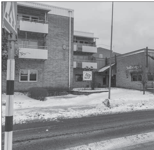
Svårt att ta sig över för den som inte går så bra eller t.ex. har rullator.

Det fanns också spår av steg, så flera personer hade klivit i vallen för att ta sig över. Detta är en sak som vi måste se till att det åtgärdas, om inte förr, så till nästa år. När man plogar, så måste föraren