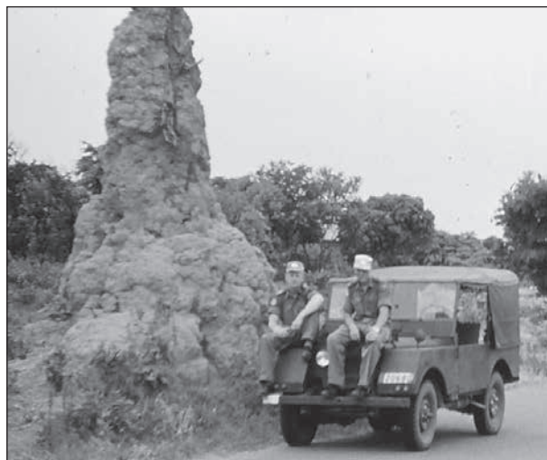
Imponerande termitbygge vid vägkanten.