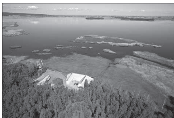
Läs om utflykt till Tåkern och Omberg på sidan 8.