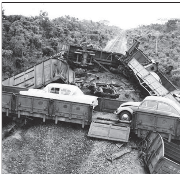
Det var inte lätt att ta sig fram med tåg när järnvägen såg ut så här.

Nitton svenska soldater stupade. FN-styrkan lyckades till slut bemästra situationen. För sina insatser tilldelades FN:s fredsbevarande styrkor Nobels Fredspris.