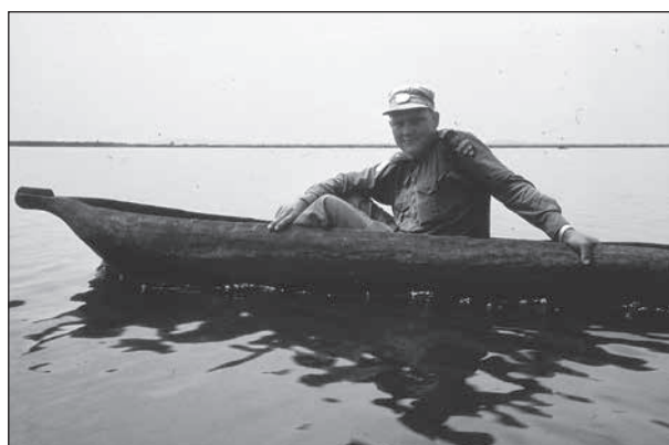
En stillsam båttur en ledig dag i Kongo.