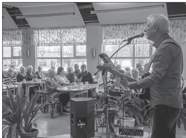
Ca 50-60 personer kom för att lyssna på Bengt Olof Söderberg som är en välkänd och populär underhållare.

Han började med att sjunga om ett glatt humör, och sedan kom en något anpassad version av "Flottarkärlek" som stämde mer med 2018 än 1950-talet.