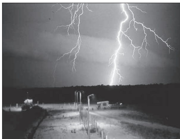
Nattligt åskväder nära FN-förlägningens ammunitionsförråd.

Sune Eriksson har välvilligt gett oss ett urval bilder som vi publicerar.