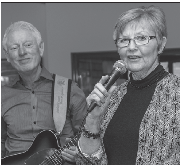
Efter välkomsthälsningen var det full fart på sång och musik.

Kulturrundan sker i samverkan mellan kommunen, svenska kyrkan, vuxenskolan, kontaktservice, ABF och NBV och med SPF seniorerna som värddar på Solbringan.