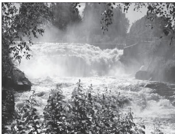
Så här mäktig är Munkforsen bara några dagar per år.

Kl. 11.00 åker vi till Munkfors där vi först besöker industrimuseet, tittar på Munkforsen (damm-luckorna öppna kl. 12-16) och sedan äter lunch kl. 13.00.