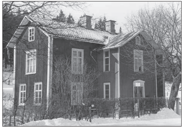
Sjukstugan byggdes 1815 som fattigstuga men blev sjukstuga 1884.