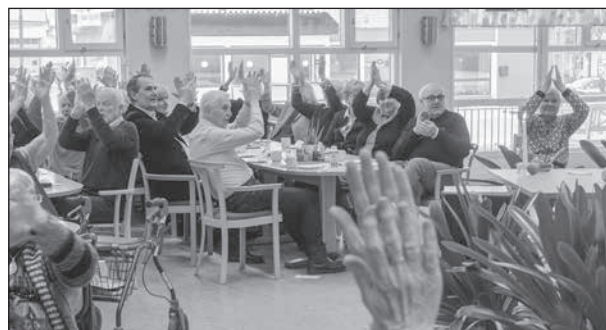
Att få röra på sig till musik är alltid bra.

Även "Idas sommarvisa" och "Torparrock" önskades av publiken. Till den senare utförde publiken viss "gymnastik".