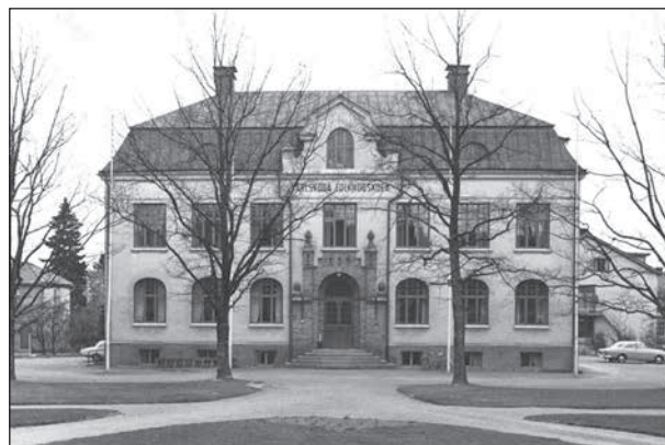
Karlskoga Praktiska Läroverk, numera Kulturskola.