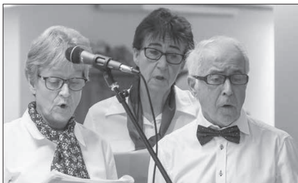
Några engagerade sångare i närbild.

Före kaffepausen kom sedan några för kören nya melodier. Under pausen stämde en herre i publiken upp med "O sole mio".