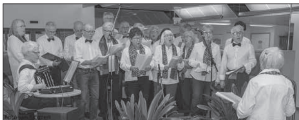
En pigg och glad kör med mycket sångarglädje.

Vi var ett 50-tal i publiken som lyssnade på Torsdagskören från östra PRO. De medverkade tidigare i kulturrundan i mars 2017 och består av 20 medlemmar, både män och kvinnor.