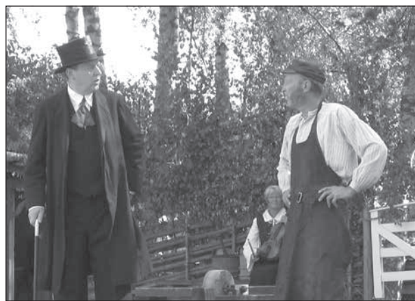
En tidigare upplaga av Frödingspelet: Å gubevars för dumt folk!

Busskostnad vid 20 deltagare uppskattad till 330 kr per person. Tillkommer kostnad för önskad förtäring, t.ex. nävgröt.