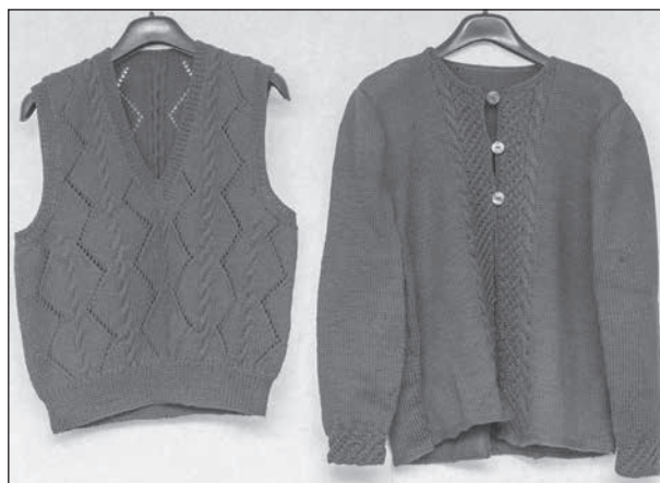
Några exempel på välstickade tröjor. Den undre har ett avancerat mönster i flera färger.

Vi fick höra många positiva ord om vår tidning som ansågs vara väldigt rolig att läsa och man såg alltid fram mot att få den.