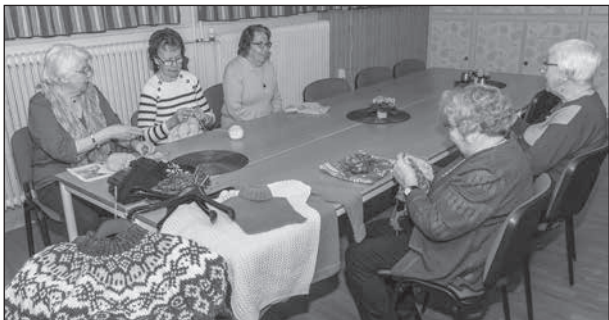
Verksamheten var i full gång när vi kom.

Vi besökte stickkaféet när det återuppstod under hösten och nu gjorde vi ett nytt besök den 12 februari. Man träffas varannan måndag i Träffen-lokalen. Vi kände den varma och välkomnande stämningen redan ute i tamburen när vi hängde av oss ytterkläderna. Vi såg flitens lampa lysa inne i lokalen och hörde viljan att hjälpa och uppmuntra varandra.