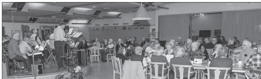
En stor och nöjd publik på kulturrundan.