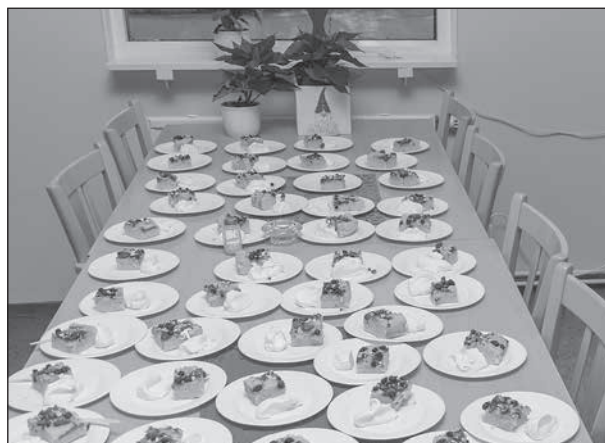
Kakan är klar att servera!