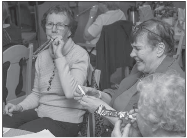
Alla kan bli barn på nytt när det ges tillfälle.

Sen var det dags att dansa ut julen med musik som började med ”Hej tomtegubbar kom och dansa.” Uppmaningen följdes med råge genom rörelser och handklappningar sittande eller stående. Julen blåstes ut med den flärp alla fått i fiskdammspåsarna.