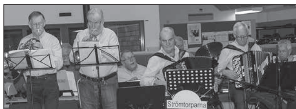
Strömtorparna i full verksamhet.

Under fiket fick jag höra "De spelar bra",