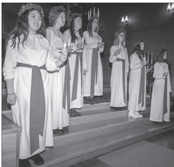
Karlskogas Lucia med tärnor sjöng för oss.

För mig som är född och uppvuxen inom 08-området var december den mest spännande månaden på hela året. Nobelpriset delades ut den 10 och så var det lucia den 13. Genom åren kunde man läsa i tidningen om förskräckta nobelpristagare som vaknade upp i sina hotellsängar på morgonen omringade av en änglakör som sjöng för dem. Det måste ha varit en exotisk upplevelse för den som till skillnad från oss nordbor aldrig varit i kontakt med ljusbringerskan.