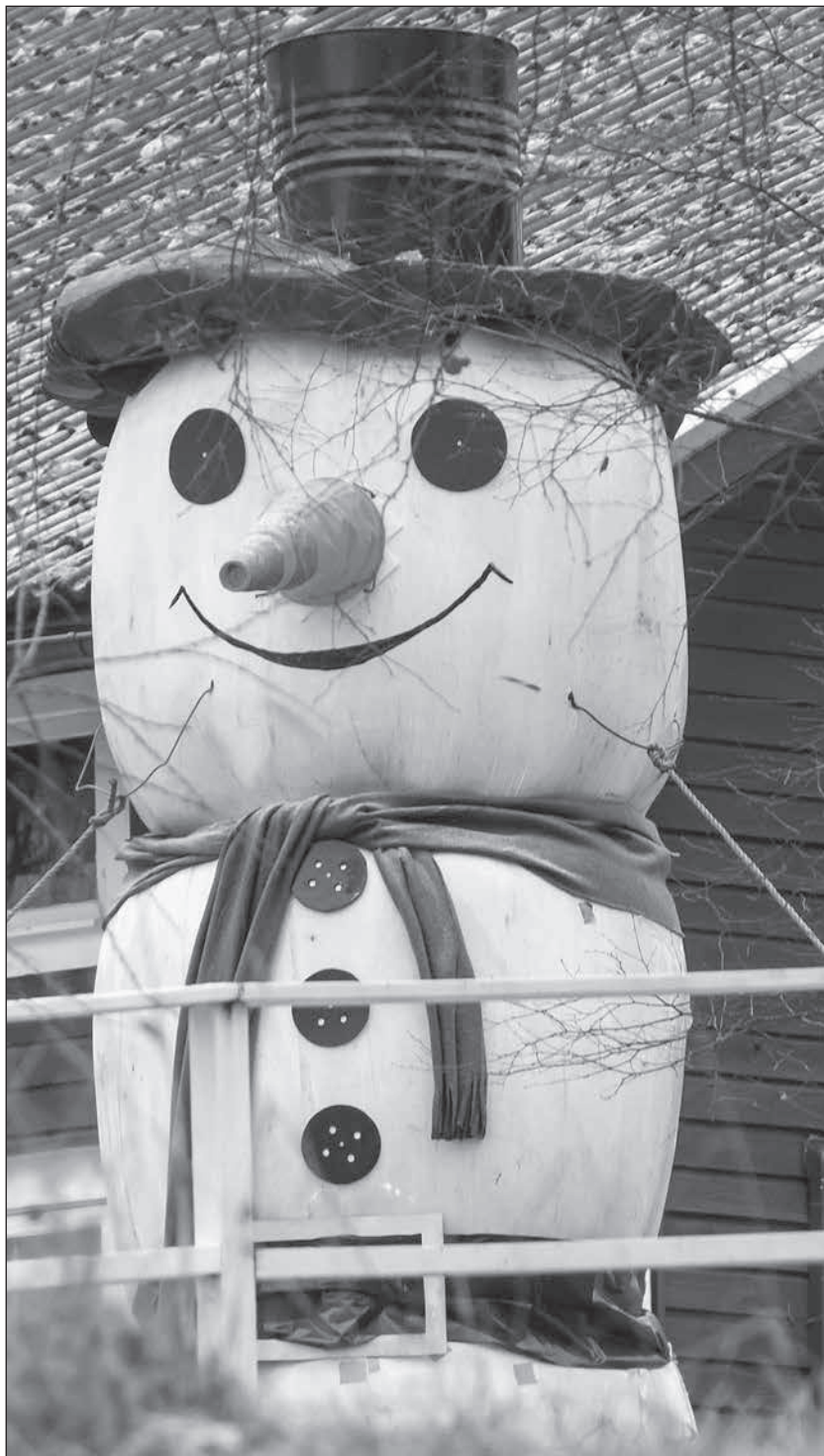
Snögubbe på Berget i Degerfors.

Kul efter jul var riktigt kul! Läs på sidorna 6-7