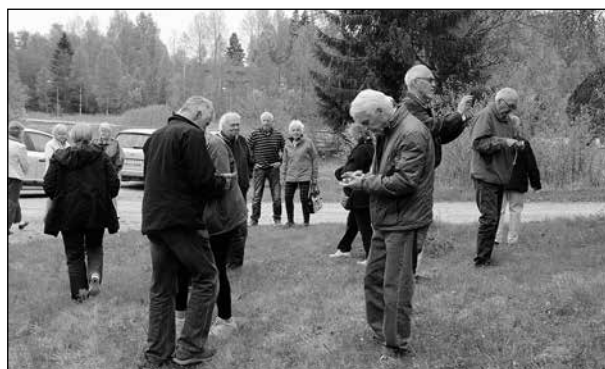
Paus vid minnesstenen i Mangskog under resan till Arvika.

Det var ett fantastiskt bildspel med så mycket innehåll. Min tanke blev direkt att det här skulle jag behöva uppleva en gång till. Egentligen borde det kunna ingå i en temakväll om Fröding.