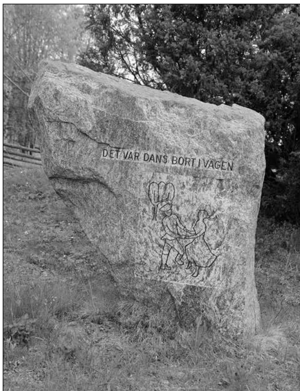
Minnesstenen. Det var här det dansades när Fröding fick inspiration till sin dikt.