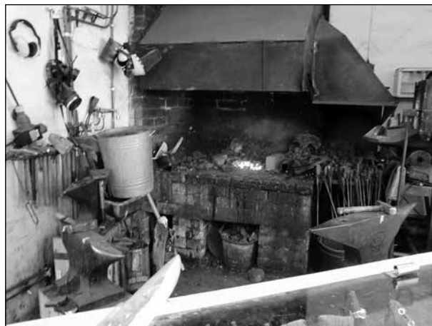
Interiör från smedjan.

restauranger på en sån liten ö som tog ca 15 min att gå runt och 8 min tvärs över. Ett båtmuseum visade många målningar av båtar, mest fiskebåtar från förr. Den äldsta var från 1600-talet. Det fanns en smedja som tillverkade smycken och även hade visning av gamla handklovar, gångjärn och verktyg.