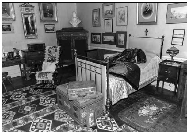
Ett sovrum i Löfstad slott.