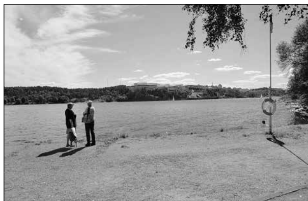
En härlig sommarvy från Fjärderholmarna.

Vi njöt av den sköna värmen och solen som gassade hela dagen.