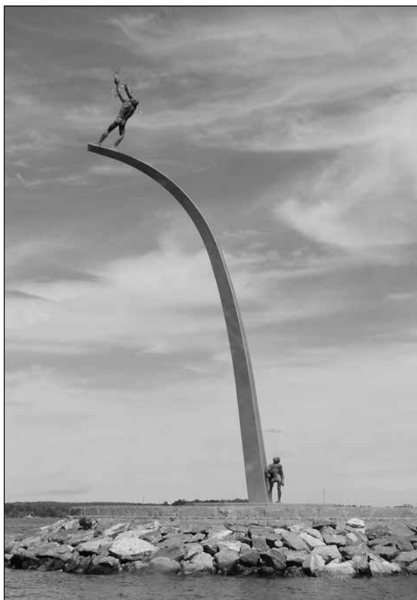
Statyn vid Nacka strand.

Bussen fortsatte sedan ner till Nybrokajen där vi tog båten ut till Fjärderholmarna. Vi passerade Nordiska museet, Vasamuseet och Gröna lund. Ett fantastiskt stort fartyg låg vid stadskajen, det verkade vara ett kryssningsfartyg där hytterna hade balkonger.