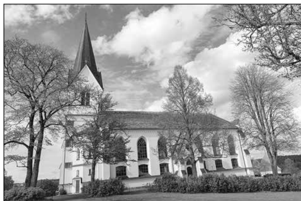
Brunskogs kyrka. Den var grann och ny när Fröding skrev sin dikt och det gäller även i dag.

Den hade vi inte hunnit med under dagen. Turistbyrå angav att den stängdes kl 17.00. Men vi var tre bilar som tog en chans. Den var öppen. Gustaf Fröding besjunger kyrkan: "Brunskogs kyrka stod och lyste som en bondbrud, grann och ny" (Vackert väder, 1891). Kyrkans exteriör är densamma som på Frödings tid. Vid en åskbrand 1972 förstördes hela interiören och den har nu ett modernt utseende och är mycket vacker. Den är väl värd ett besök.