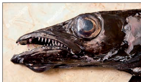
Espada, efter att ha plockats upp från 2000 m!

Espetada , fläskkött i bitar, som grillas på kvistar av lagerträ och sedan dumpas på din tallrik. Mycket gott!