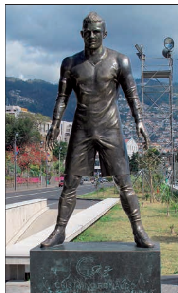
Om man anser att fotboll är kultur, så kan man knäböja vid en staty av Ronaldo , som kommer från Madeira!

Espada (dolfisk), en smal fisk, som lever djupt ner i havet och ser ut så här på marknaden.