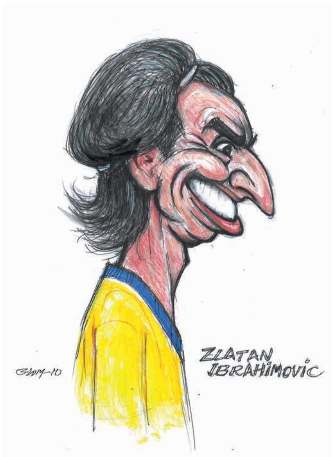
Zlatan Ibrahimovic i en karikatyr från 2010.