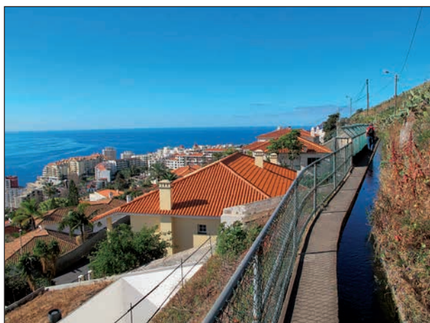
Levada, lagom långt från stan!

Ett måste på Madeira är att traska längs någon av de många smala bevattningskanalerna, s k levador , som det finns många av runt hela ön.