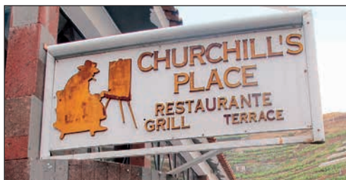
I denna by trivdes tydligen Churchill!

På första bilden ser man i fjärran den höga klippan Cabo Girao , där det finns en utsikts-plata 500 m rakt upp från havet!