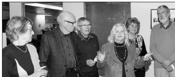
Avtackning av avgående funktionärer.

Att välja ombud till distriktsstämman överläts till styrelsen. Våra ombud i KPR omvaldes på ytterligare ett år.