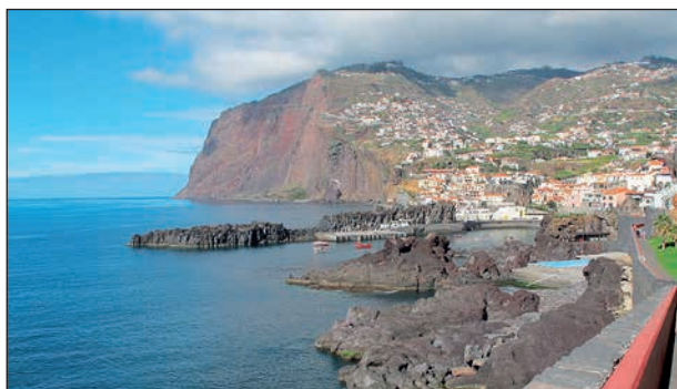
Mot Camara Del Lobos.

Från vår lägenhet vandrade vi några gånger ca 5 km till byn Camara Del Lobos . Längs den breda gångvägen har man fin utsikt mot havet, ser diverse växter och möter andra spänstiga(?) människor.