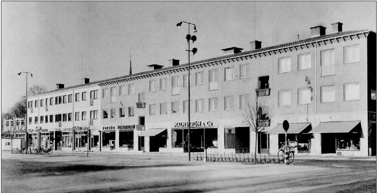
Västra delen av torget i början av 1940-talet. EPA-huset under uppförande.

Undertecknad har tillsammans med goda vänner och tidigare affärskollegor ibland anledning att prata om affärslivet, hur det var förr och hur det är nu och då kommer vi ofta fram till intressanta jämförelser.