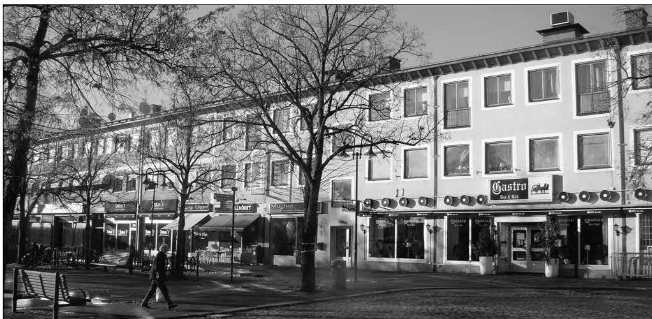
Så här ser västra delen av torget ut i dag.