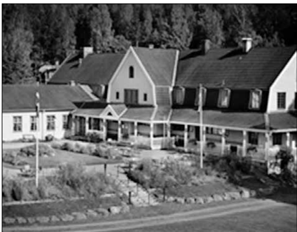
Huvudbyggnaden med restaurang: Stora Societeten.

De Vetgiriga Veteraner som hade samlats på Solbringen den 15 september fick veta mycket om Loka Brunn.