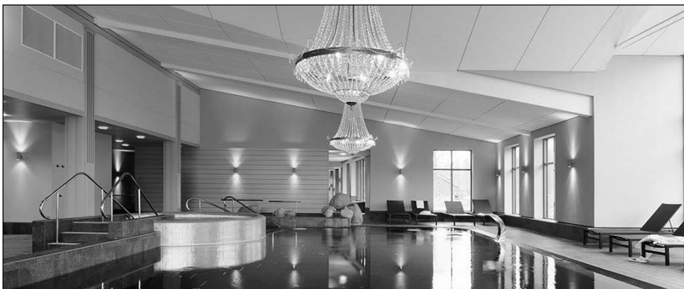
Vattensalongen i Lokas nya Spa.

Redan på medeltiden hade pilgrimer på vandring mot Nidaros ett rastställe här, eftersom det var en fin plats och det fanns friskt gott vatten. Seden att resa till kurorter lärde sig svenskar ute i Europa under och efter 30-åriga kriget. På 1720-talet började kurorter grundas i Sverige, speciellt av Urban Hjärne. Medevi var den allra första. Det var "hattarnas" brunn. Loka blev "mössornas" men det blev även populärt bland kungar.