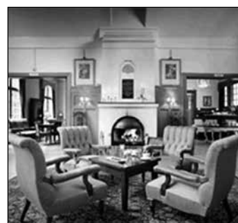
I stora salongen kan man koppla av vid brasan.