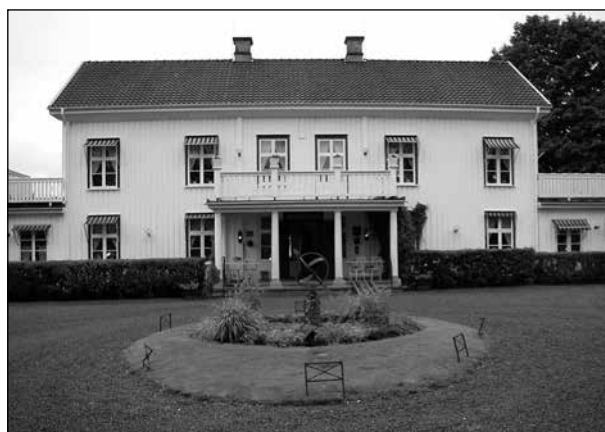
På Länsmansgården i Sunne fanns en konstutställning.

På Länsmansgården i Sunne fick vi en god lunch och lite guidning av ägaren. Gården ligger mycket vackert med utsikt över Övre Fryken och med nyss utsläppta kor som sprang ner till vattnet för att dricka.