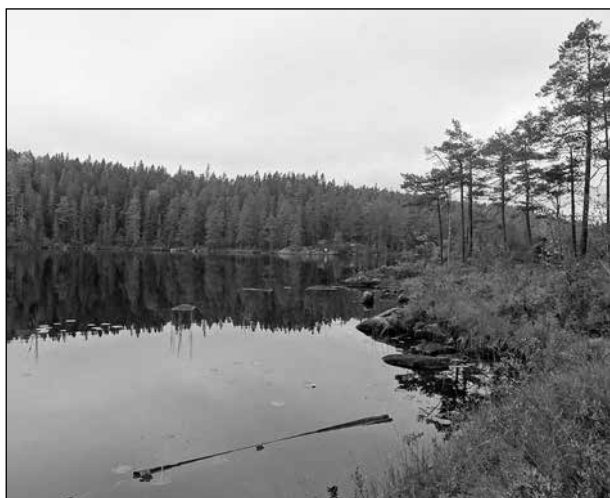
Sjö i Murstensdalens naturreservat.

Murstensdalen är det näst största och mest vildmarksartade av naturreservaten i Örebro län. Det ligger 25 km norr om Karlskoga och söder om Loka. Centralt finns en höjdplatå och i öster sprickdalar med bergsbranter. Högsta punkten är 306 meter över havet, den lägsta 190 meter. Det finns ett antal sjöar, tjärnar och myrar.