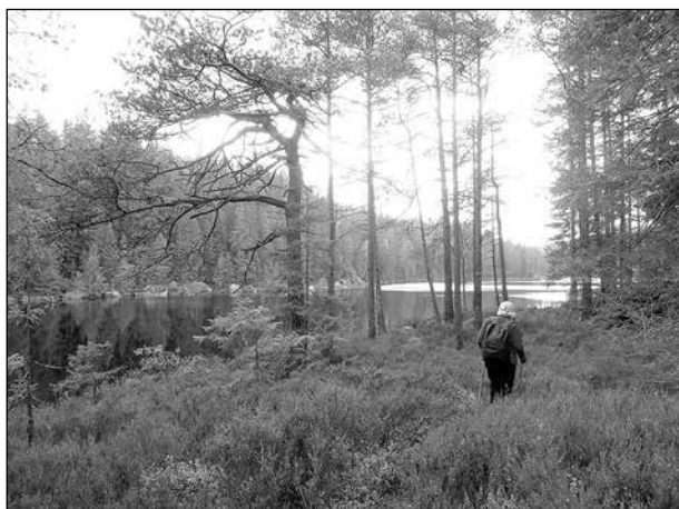
Man behöver inte vara i fysisk toppform för att kunna vandra i Murstensdalens naturreservat.

Hela området är väglöst och består av orörd vildmark och det ger ett mäktigt intryck. Väl markerade stigar och rastplatser finns. Alla sankpartier är spångade. Den vandring vi gör är ca 9 km. Vi kommer att vandra i lugn takt.