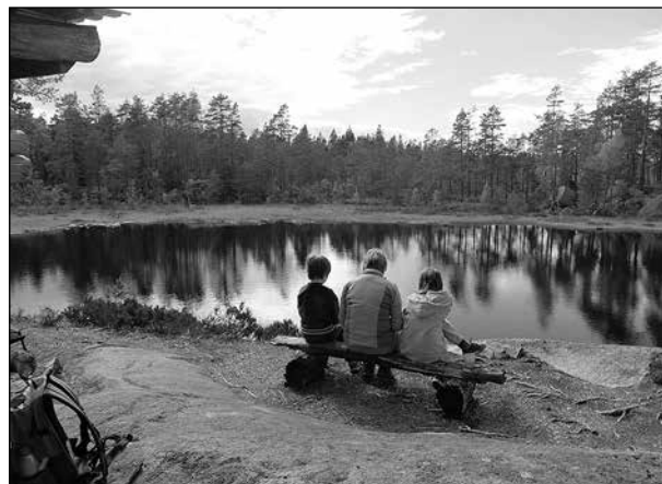
Rastplats vid Gruvtjärn i Murstensdalens naturreservat. Detta och övriga foton är tagna av undertecknad. Vill du veta mer är det bara att söka på nätet där det även finns ett mycket omfattande bildmaterial sammanställt av entusiastiska besökare till Murstensdalen.

Halvvägs tar vi en längre matrast vid en rastplats och därutöver kortare pauser.