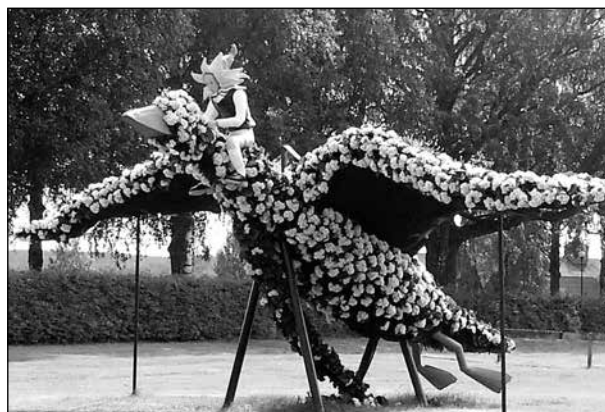
Vi hann med en sväng förbi Rottneros och kunde se den här versionen av Nils Holgersson utanför.

På Länsmansgården i Sunne fick vi en god lunch och lite guidning av ägaren. Gården ligger mycket vackert med utsikt över Övre Fryken och med nyss utsläppta kor som sprang ner till vattnet för att dricka.