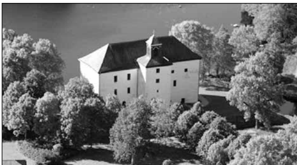
En av "gårdarna runt sjön".

Gårdarna runt sjön är titeln på den första i en serie romaner av Birgit Sparre. Sjön är Åsunden som ligger i närheten av Ulricehamn.