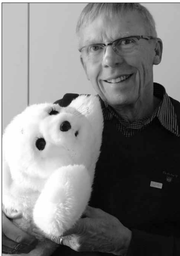
Robotsälen Harry kan charma vem som helst.

Sälen är mjuk och skön och mycket charmig. Den har visat sig ha en lugnande inverkan på äldre människor med olika typer av demens. Meningen är att man ska ha den i knät. Den har inbyggda sensorer och vid små klappningar kan den då öppna och stänga ögonen, lyfta på huvudet och röra på fenorna och den låter dessutom som en säl.