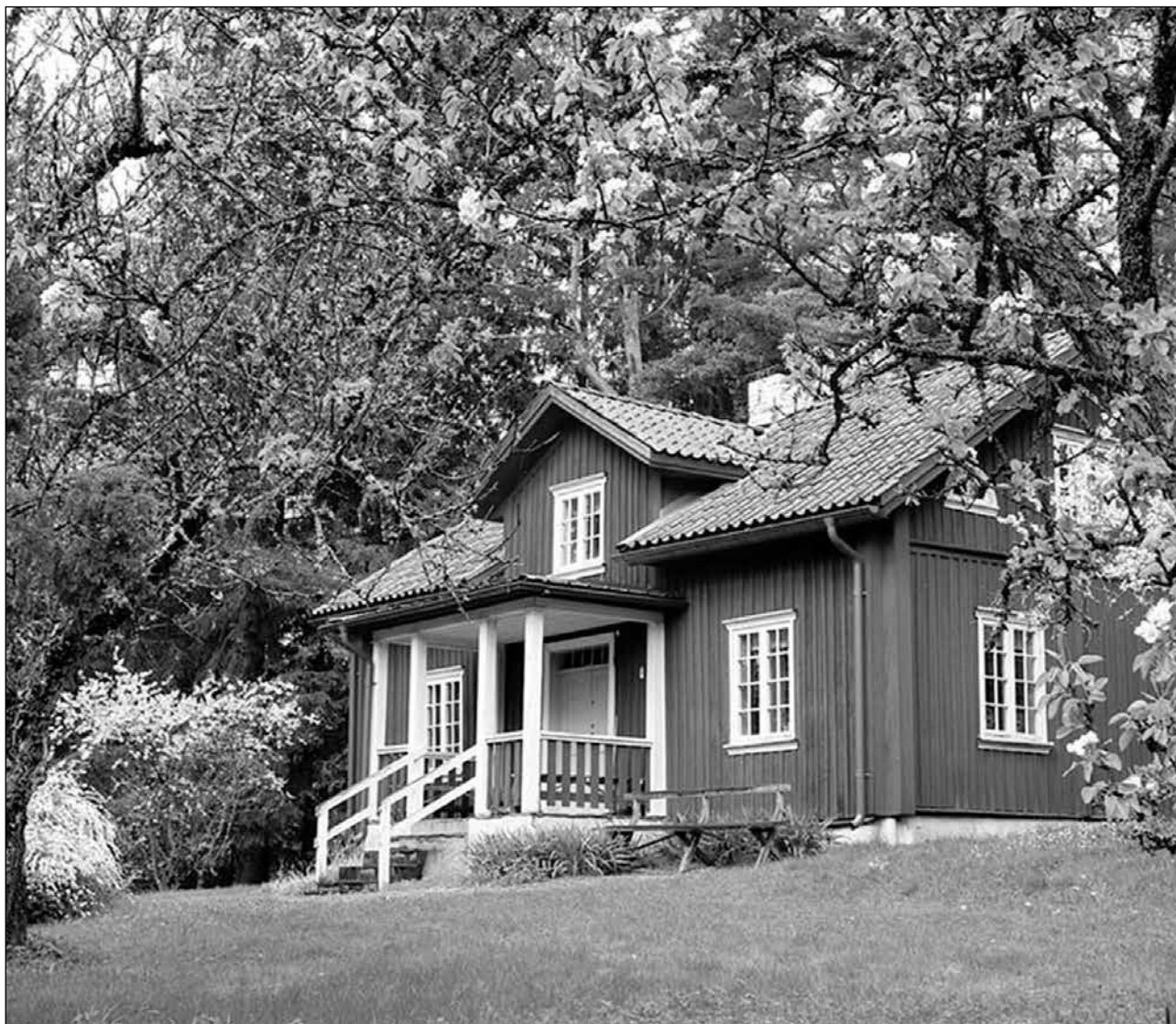
Lars Magnus Ericssons minnesgård i Värmskog. Läs mer om vårutflykten dit på sidan 7.

Distriktets årsstämma Läs på sidorna 4-6