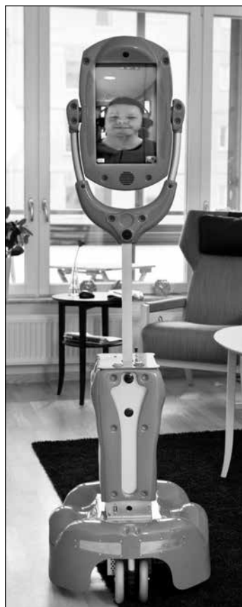
"Giraffen" är ett utvecklat kommunikationssystem.

Den största uppmärksamheten väckte Giraffen, se foto, som är en robot för virtuell kontakt mellan exempelvis en vårdtagare som bor hemma och personal och anhöriga på annan plats. Överst på Giraffens långa "hals" finns en skärm för bild- och talkommunikation. Den står på hjul och kan, via fjärrstyrning, köras runt i hemmet hos vårdtagaren.