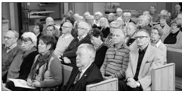
Här ser vi deltagare från andra delar av distriktet.