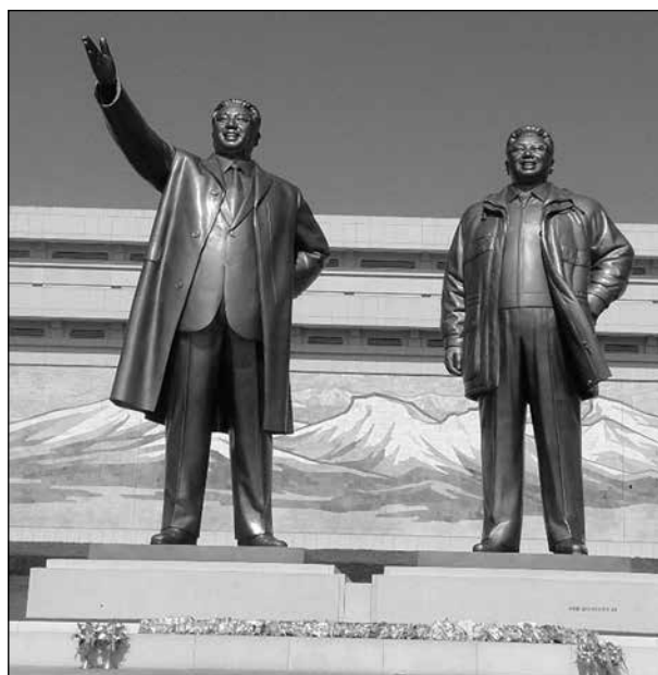
27 m höga bronsstatyer av Kim Il Sung och Kim Jong Il som står på ett 5 m hög fundament. Varje dag läggs blommor för att hedra ledarna, som anses ha gjort så mycket gott för sitt folk.

Det var stor skillnad mellan Kina och Nordkorea när det gällde biltrafik. I Nordkorea var det glesst med bilar. Trots att det inte fanns en bil i sikte