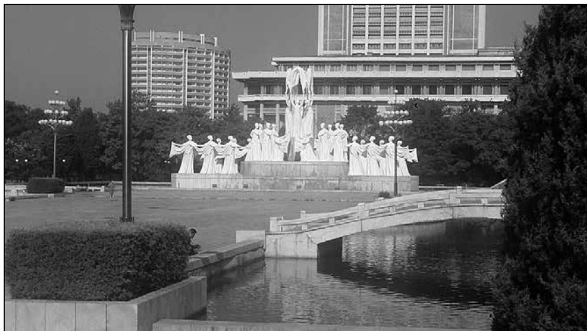
Överallt finns stora rena välskötta parker med vackra statyer och monument. Detta monument heter snö.

Man är mycket för offentliga utsmyckningar och tar gärna efter byggnader i andra delar av världen. T.ex. fanns en triumf-