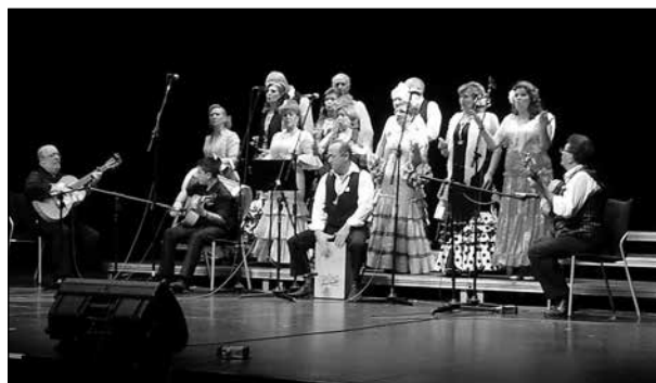
Spansk kör med gitarrer och blåsare i Teatro Municipal.

Vi träffade också vänner och jag spelade till och med bridge några gånger hos Mas Amigos!