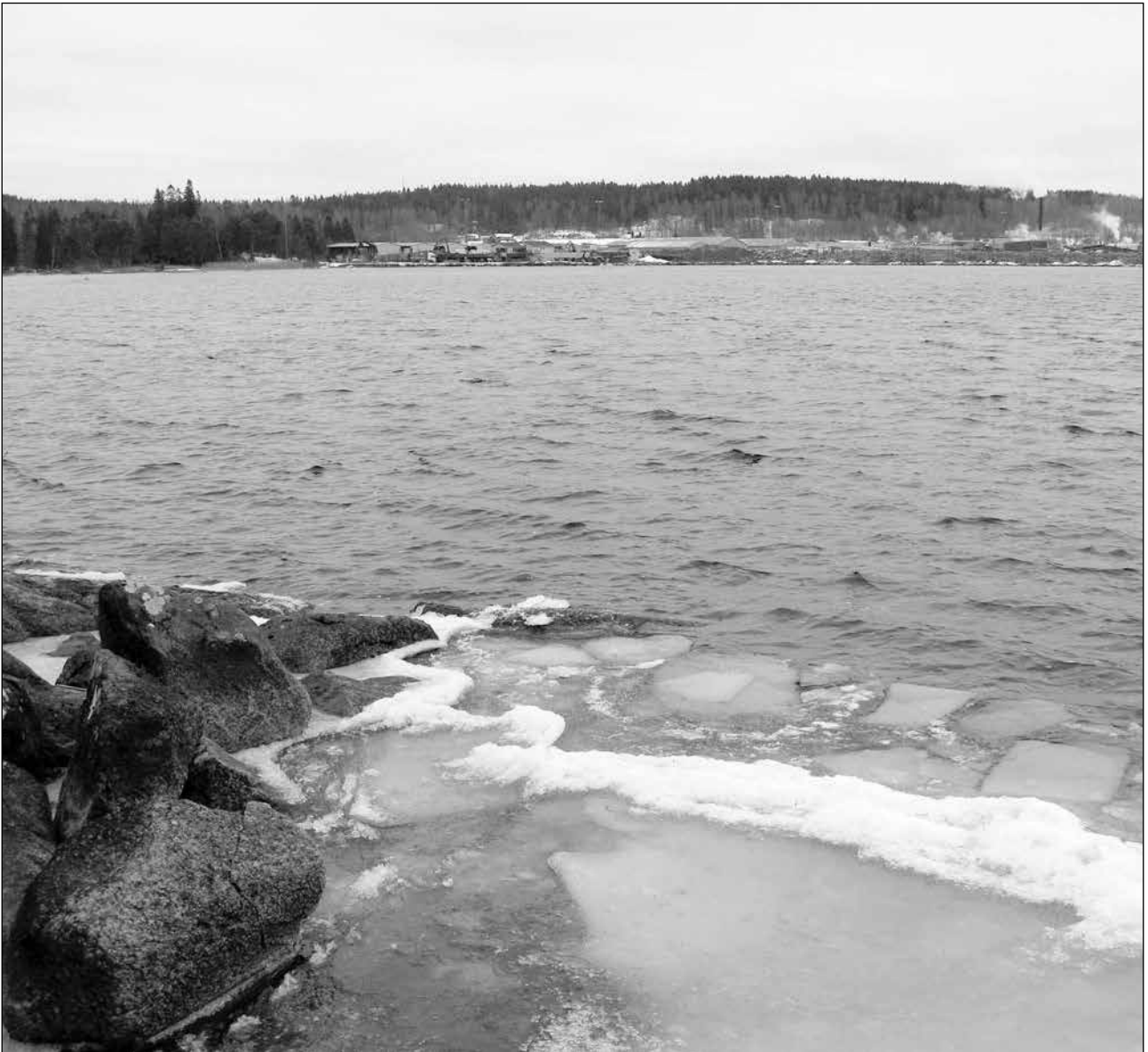
Möckeln var isfri nära Sandviksbadet den 16 februari!