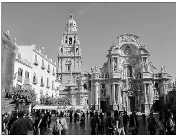
Den vackra katedralen i Murcia.

I Torrevieja finns flera stränder, men inga stora turisthotell, utan mer vanlig spansk stadsbebyggelse. Förutom bad och måltider i och utanför