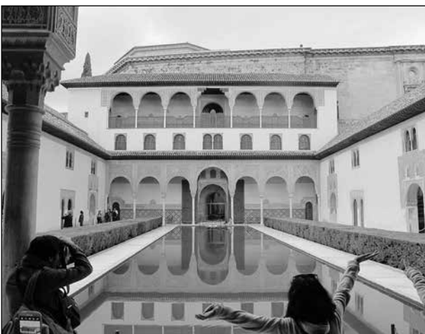
Det moriska palatset Alhambra.

Tredagarstur till Granada , ca 35 mil, för att bese Alhambra , detta enorma komplex med parker, tempel och andra imponerande byggnader. Man bör boka biljetter i förväg!