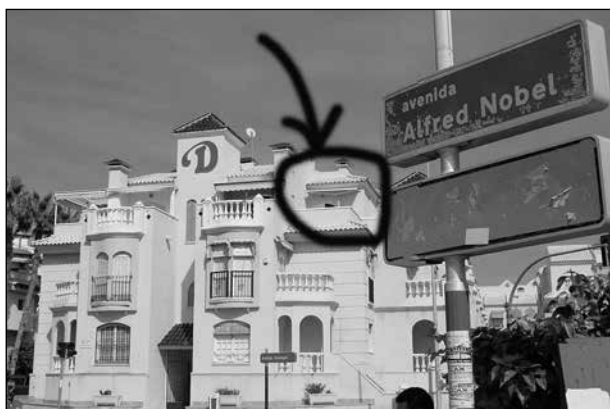
Här bodde vi på Avenida Alfred Nobel.

På Mas Amigos hemsida letade vi efter en lägenhet, med WiFi förstås! Valet blev lätt, när det fanns ett alternativ på Avenida Alfred Nobel .