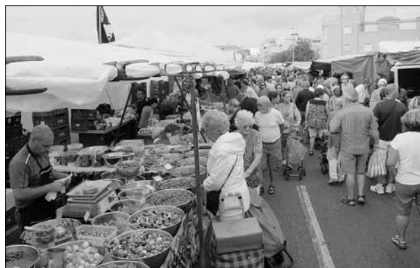
Marknaden i La Mata.

lägenheten, så promenerade vi nästan varje dag. Ofta gick vi längs stranden nära havet, men också på andra ställen. Fina vyer har man, om man går ut på den långa piren i hamnen nära centrum.