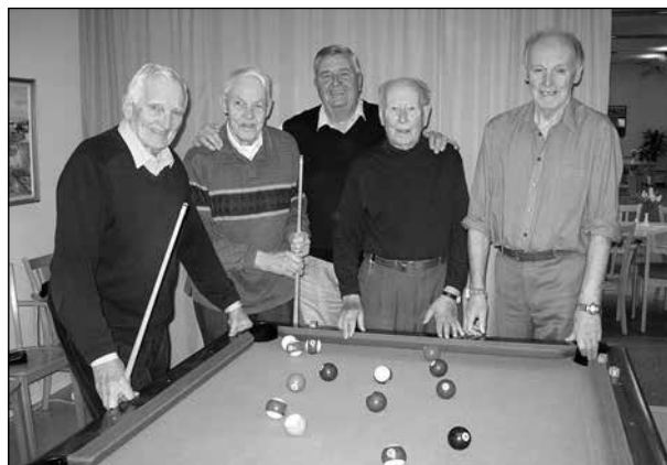
Ett gäng glada gubbar: SPF:s biljardgrupp.

Här är SPF:s biljardgrupp samlade för spelning på Solbringan en fredagsförmiddag.