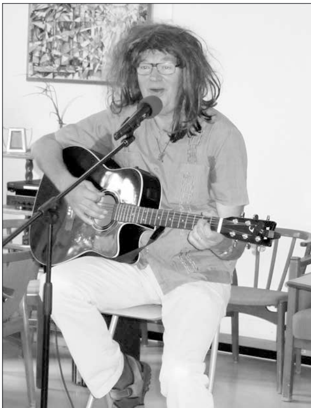
Rune gestaltar tjejen som inte lyckas bli trendig.

”En välanpassad man” innehöll en dos själviro. Ett nummer krävde peruk för att Rune ville likna den tjej han sjöng om som hade problem med att bli trendig.