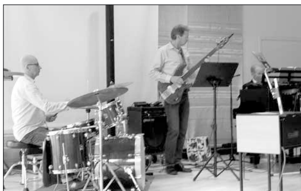
Jazztrio i aktion.

Efter tack till orkestern inledde Kajsa mötet med att informera om att den nystartade arbetsgruppen