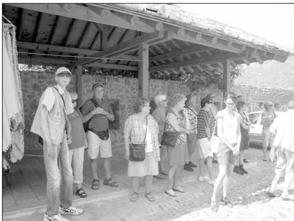
Torget i Pocitelj.