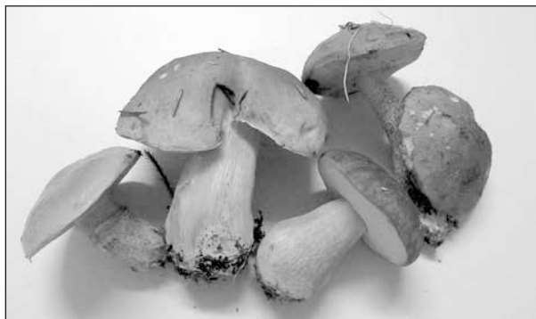
Soppar. Av de här är det bara den gula lärksoppen (t.v.) som inte är så mycket att ha.

sällsynt sopp, hålsopp, som har fått sitt namn av den ihåliga foten.