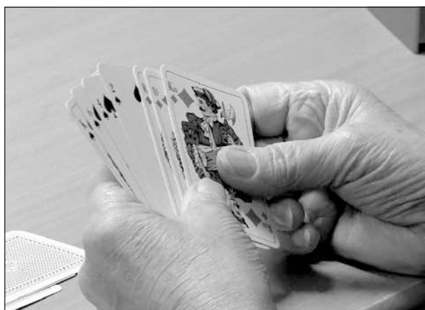
Korten på hand.