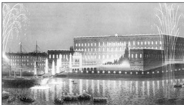
Vegafestligheterna på Strömmen 24 april 1880.

Den aprilhändelse som detta nummer knyter an till är de s.k. Vegafesterna i april år 1880. De startade i Stockholm kvällen den 24:e, när de länge efterlängta gästerna dök upp. De kom sjövägen