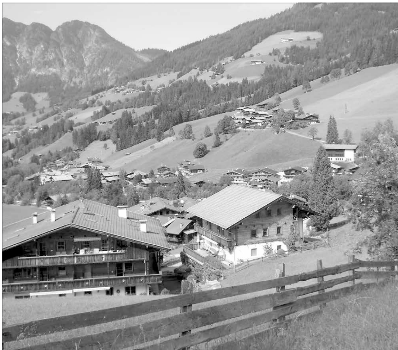
Sommar i Tyrolen.

Sveriges Pensionärsförbund – Seniororganisationen i tiden Karlskogaföreningen