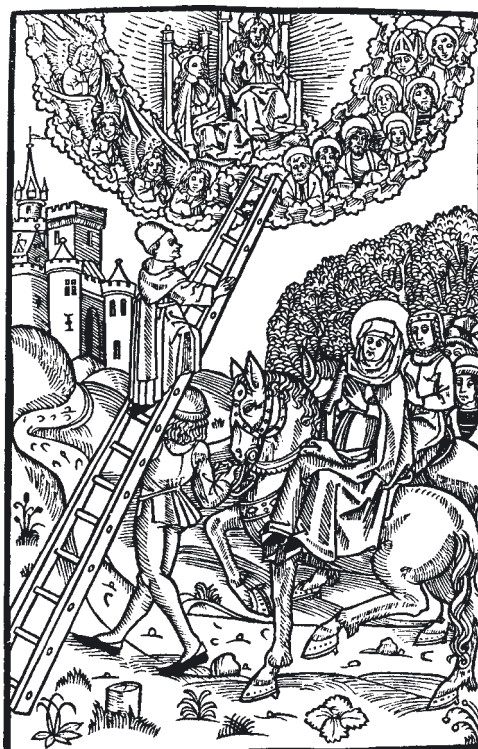
Känt träsnitt ur Birgittas Revelationer: Birgitta till häst ser en munk som är på väg till himlen för att disputera med Gud.

”Något tålte hon skrattas åt men mera hedras ändå”