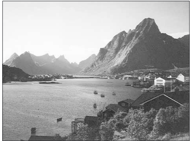
Reine på Lofoten.

För ca 100 miljoner år sedan var fjällkedjan till stor del nederoderad, men den trycktes upp 1 – 2 km, då Alperna bildades. Lofotenfjällen har fått sin alpina karaktär genom att de inte har varit helt täckta av is.