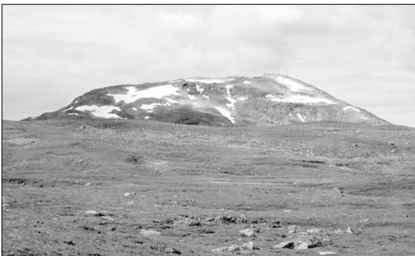
Gränsfjället Sipeke söder om Stekenjokk. (Lättillgängligt fjällområde på svenska sidan.)

Skollorna indelas i undre, mellersta, övre och översta skollberggrunden. Beroende på omvandlingsgraden i samband med överskjutningarna har de bildade bergarterna fått olika karaktär. Detta är orsaken till att fjällen i Sarek är högre och vildare än i Padjelanta och övriga lapplandsfjäll intill gränsen.