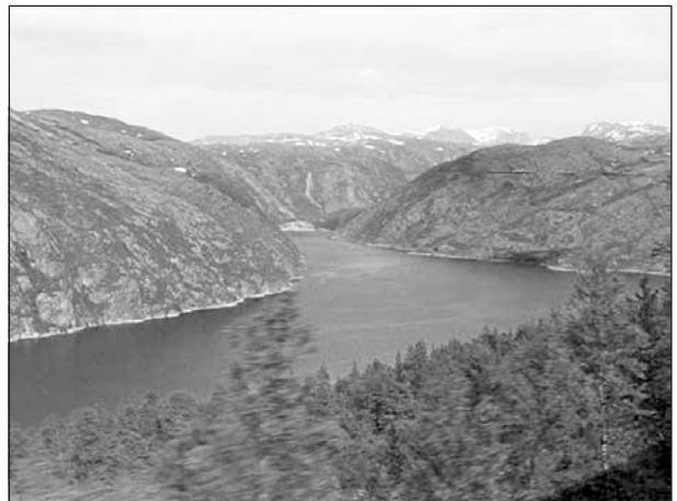
Rombakfjorden från malmbanan öster om Narvik.

Vi fick se geografiska tvärsnitt av fjällkedjan, t.ex. Narvik – Kiruna, där Allan kommenterade och förklarade de olika områdena allt kompletterat med vackra och talande bilder.