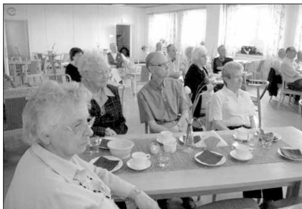
Publiken lyssnade koncentrerat.

Genom engagemang, kunskap och inspirerande samtal gjorde Sif 80+-träffen till en gemytlig stund. Många minnen väcktes hos åhörarna. Vi fick ta del av tillbakablickar och spontana berättelser. Efter kaffe, smörgås, sång, historier och lite samtal om höstträffen önskade vi varandra en glad vår och sommar.