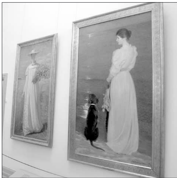
Ett par av Skagenmuseets kända målningar.

Efter frukost nästa dag åkte vi till Skagen där vi besökte konstmuseet och beundrade verk av de kända Skagenmålarna. Ljuset här har lockat hit konstnärer. Det kan man förstå när man ser tavlor.