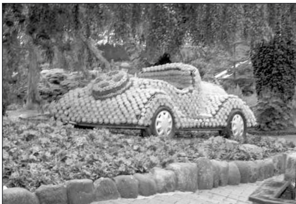
Kaktusbil på Jesperhus.

Dagen fortsatte med ett besök på Jesperhus som ligger på en udde i Limfjorden. Jesperhus har utvecklats och blivit Nordeuropas största blomsterpark. Det var verkligen storslaget med alla blommor och blomsterarrangemang. Här fanns avdelningar med ormar, gnagare och även fjärilar. Dessa områden hade tak över sig så vi slapp besväras av regn.