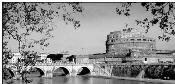
Castel Sant' Angelo i Rom.

Jag fick hjälp upp i foajén, ambulansen kom med blåljus och allt, och in stegade en man och en kvinna. Han talade som tur var engelska (min italienska är något begränsad) och sa att det här måste sys. Men det var inte panik, om jag kunde och ville se föreställningen så fick jag det, men jag måste lova att åka till sjukhuset sen. Jag kände mig inte