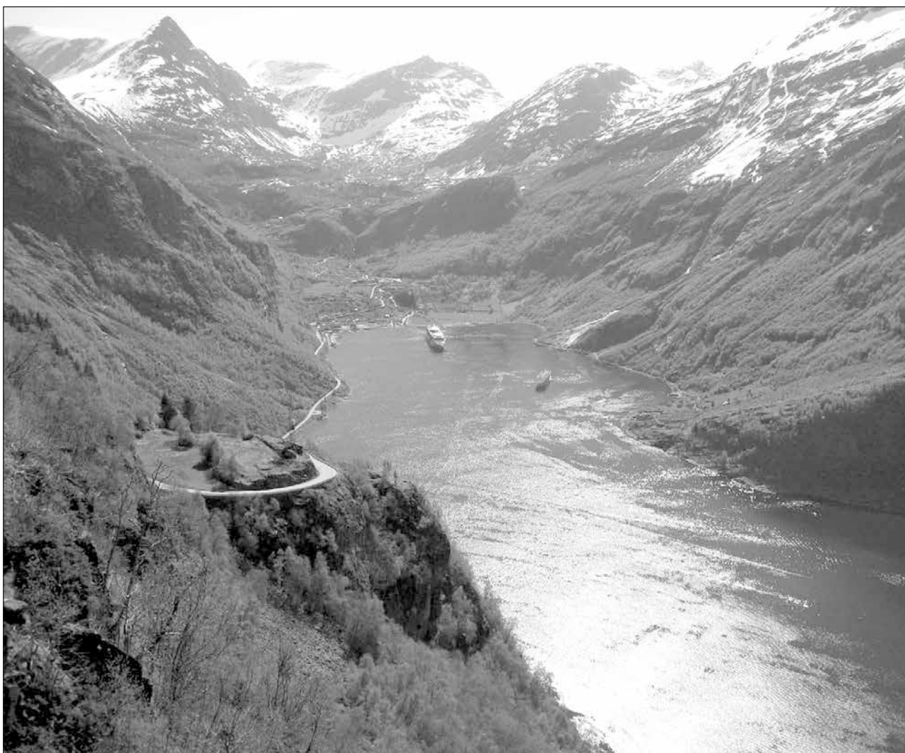
Geirangerfjorden med omgivande gnejsfjäll, bl.a. Dalsnibba 1495 m.ö.h. En av många fjällbilder som kommer att visas på Lördagsträffen den 10 september.

Sveriges Pensionärsförbund – Seniororganisationen i tiden Karlskogaföreningen