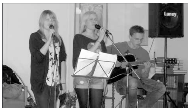
Flickorna sjöng bra och gitarristen var suverän.

Juridiken ”krävde” en kaffepaus och sedan kom en grupp elever från Karlbergsskolan och sjöng och spelade för oss. Det var elever från årskurserna 7 – 9 och de bildade flera olika grupper om 2 eller 3.