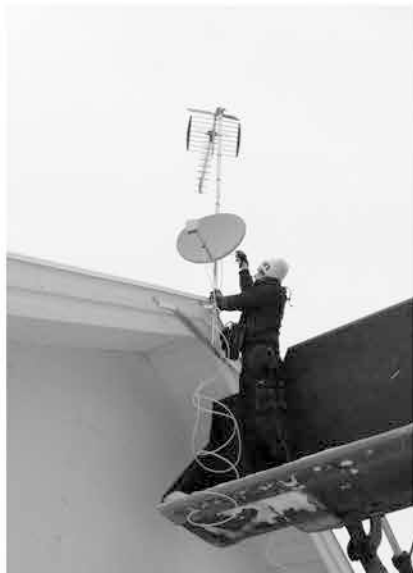
Antenninstallationer året om