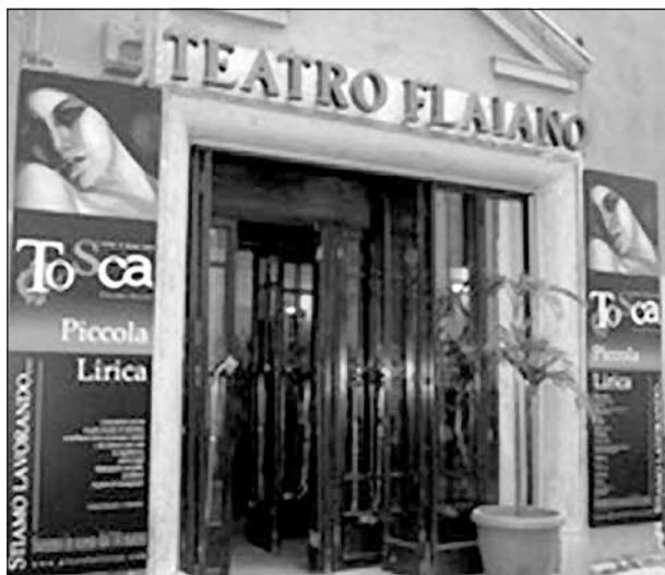
Teatro Flaiano i Rom.

Vi kom i god tid och köpte biljetter. Lite före kl. 20 när operan började skulle jag besöka toaletten, en trappa ner. Jag gick och trappan tycktes vara slut, men det var något slags extra trappsteg som jag inte såg. Jag tappade förstås balansen och i mina försök att komma på rätt köl lyckades jag ramla baklänges och slog i huvudet. Självklart skrek jag till och det blev en uppståndelse utan like.