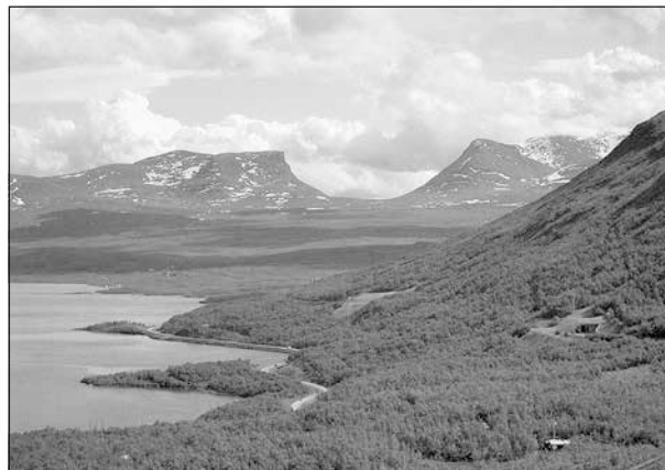
Lapporten söder om Abisko.