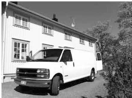
Service on-site hos kund

Ljudfabriken Service AB, Noravägen 1, 691 53 KARLSKOGA, 0586 - 333 77, info@ljudfabriken.se