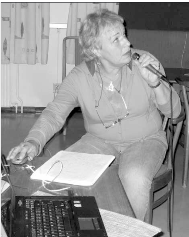
Britt var en mycket engagerad berättare.

Efter 1400-talet hörde Kambodja ibland till Thailand och ibland till Vietnam för att på 1800-talet bli franskt (en del av Franska Indokina). På