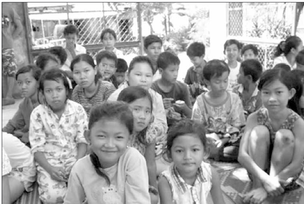
En del av fadderbarnen i Kambodja.

Ofta måste skolbarnen betala lite extra till läraren, vilket är lätt att förstå när lärarlönen är ca 40 – 50 dollar/månad. För att försörja en familj behövs ca 100 dollar/månad. Utan extra betalning klarar de sig inte. Några äldre barn går i en typ av high school och de får då för sin avgift både skoluniform och böcker.