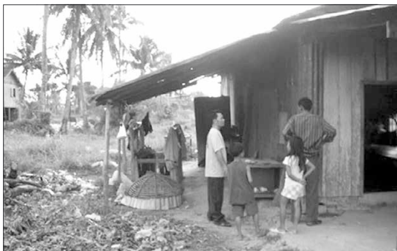
Bostadsstandarden är inte direkt vad vi är vana vid.

Vi fick en intressant och livlig framställning av hur Britts alla barn i Kambodja lever. När en föredragshållare verkligen är engagerad, då går det rätt in i åhörarna, som tyvärr var alldeles för få!