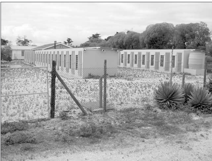
Exteriörbild från fångellet.

I allmänhet var brottsrubriceringen sabotage, och för det behövdes inte mer än att leda en grupp protesterande studenter.