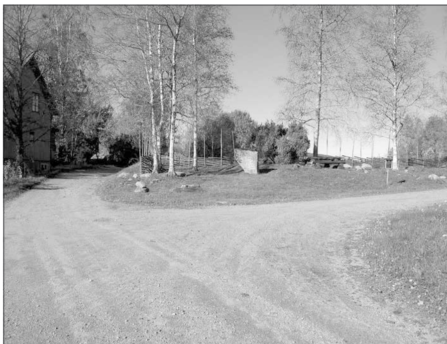
Så ser det fortfarande ut "bort i vägen".