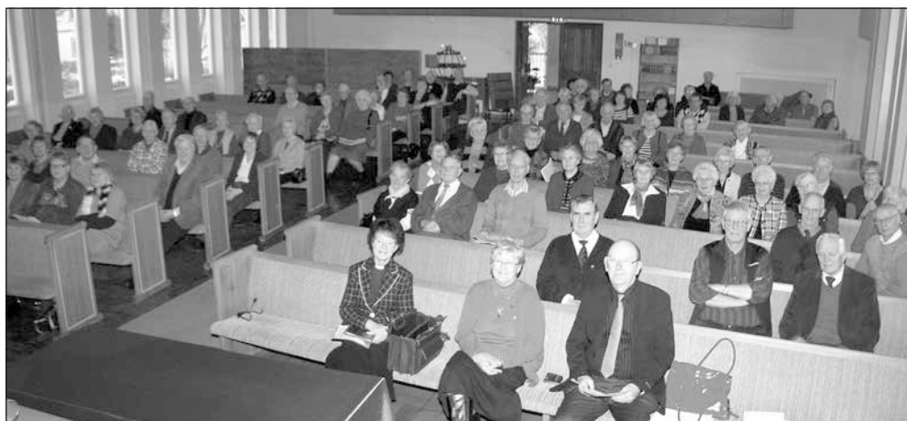
Merparten av deltagarna i årsmötet församlade i kyrksalen.