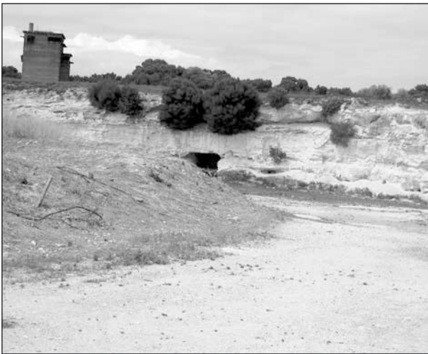
Kalkbrottet, där många fick hälsan förstörd.

Bland annat såg vi det omtalade kalkbrottet, där fångarna tvingades arbeta hela dagarna. Det enda skyddet mot den obarmhertiga hettan var en grotta där man kunde ta skydd när man hade matrast. Både ögon och lungor tog ofta skada av solljus och kalkdamm.