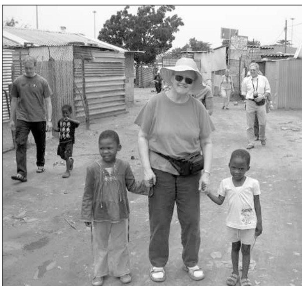
Artikelförfattarinnan tillsammans med ett par småflickor i kåkstaden.

Vi gick till kåkstaden tillsammans med en ung man vid namn Lebo, som bodde i närheten och med sin fru drev en liten restaurang med övernatt-