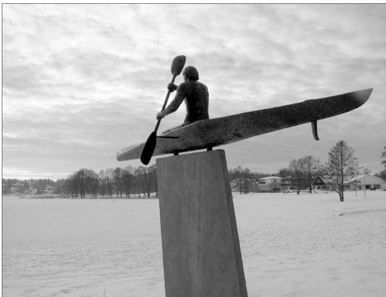
I väntan på våren en vintrig dag i januari. Konstverket med guldolympiern Agneta Andersson vid Möckelns strand.

Sveriges Pensionärsförbund – Seniororganisationen i tiden Karlskogaföreningen