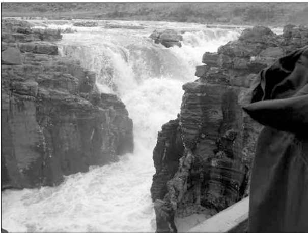
Bourkes Luck Potholes.