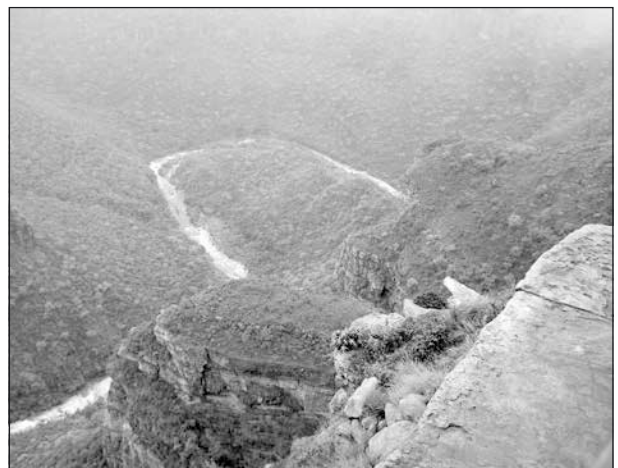
En blick ner i Blyde River Canyon.

Eller när Blyde River på ett annat ställe kastar sig utför ett brant stup i en forsande ström vid Bourkes Luck Potholes.