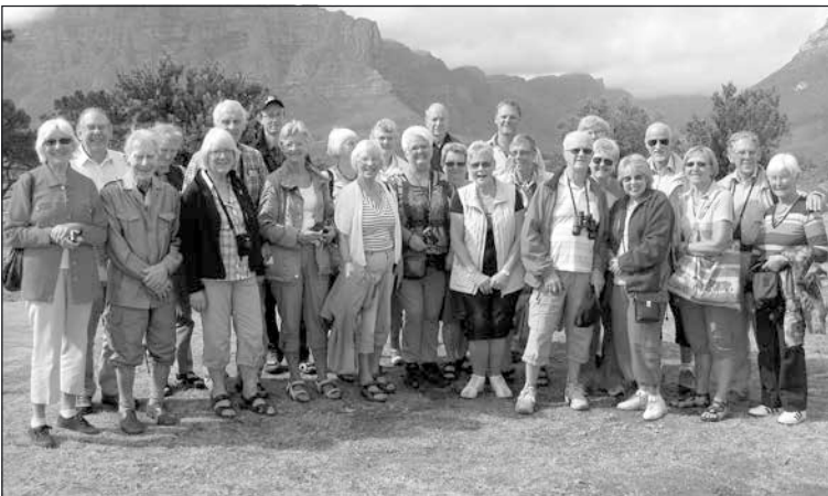
Deltagarna i SPF-resan.

SPF:s sexton dagar långa resa till detta avlägsna resmål blev en verklighet som vida överträffade vad vi alla hade föreställt oss. Detta inte minst tack vare vår utmärkte inhemske guide Nico som talade flytande svenska.