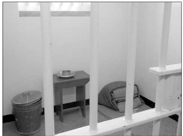
Fånge 455/64 Nelson Mandelas cell.

En mycket stark upplevelse var besöket på Robben Island, fängelseön utanför Kapstaden. Robben Island blev ett gripande men också glädjande möte, då ön inte längre är ett fängelse för oliktänkande utan ett nationellt museum.