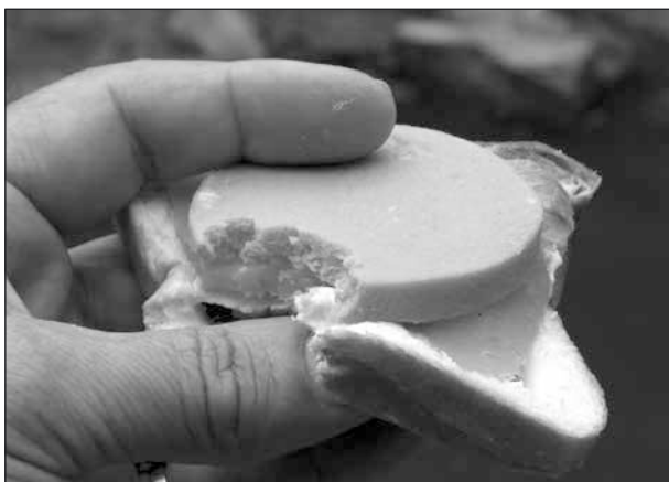
Till min förvåning finns god falukorv även i Kina – fast den heter nog inte så förstås.