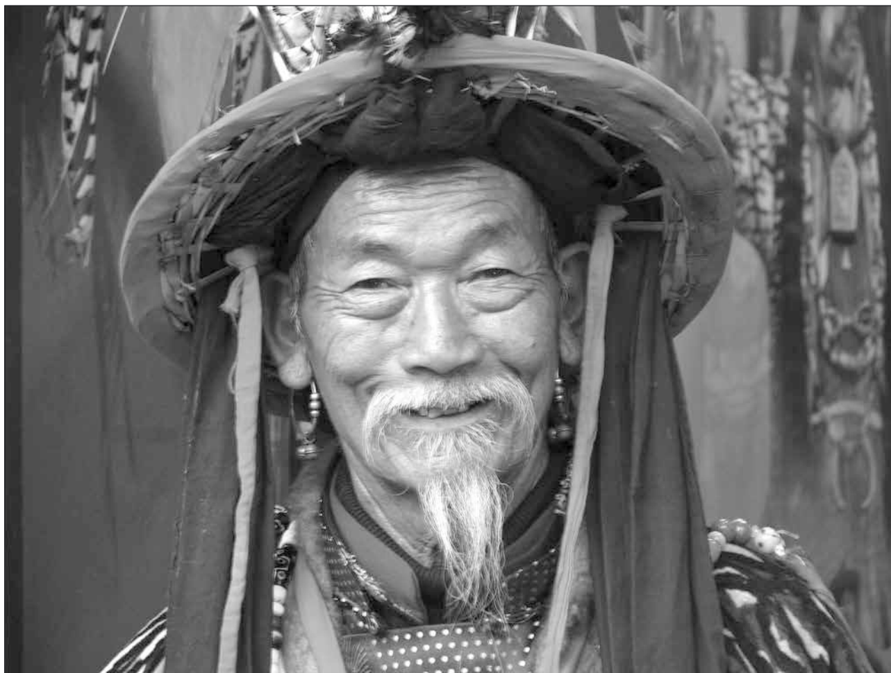
En tibetansk byhövding från en by i provinsen Yunnan i sydvästra Kina hälsar Månadsnyttts läsare den här månaden. Yunnan gränsar till Tibet och många av folkslagen här är genuint tibetanska.