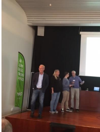
Bosse, repr.fr.Studieförb ABF.& Even