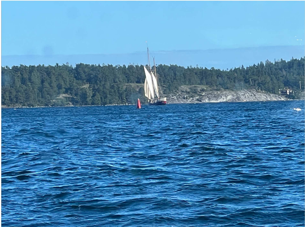
På väg hem över havet såg vi denna farkost