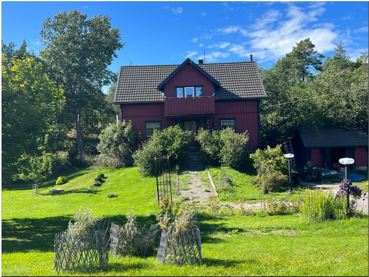
Några exteriörbilder från vår Möjapromenad