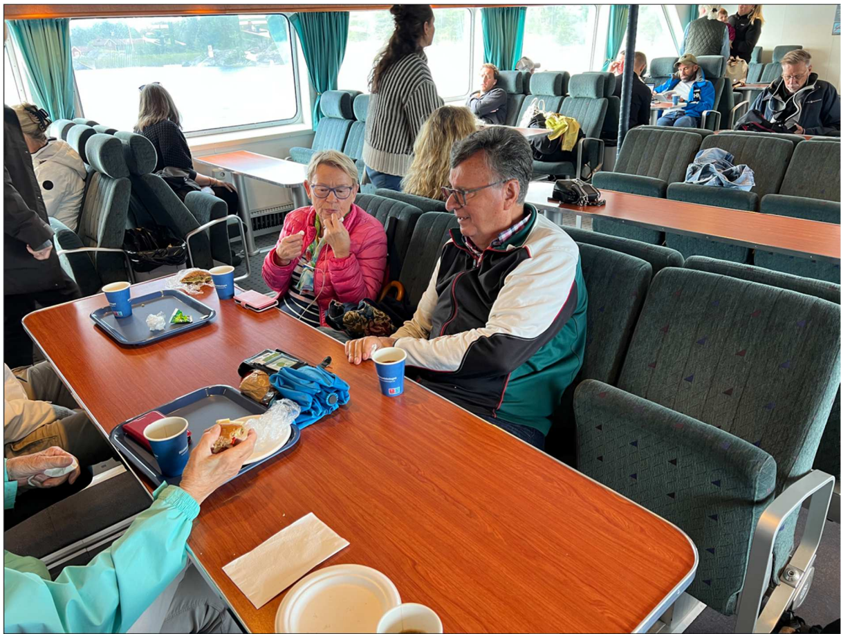
Det fanns förtäring ombord om många försåg sig med kaffe och fralla.