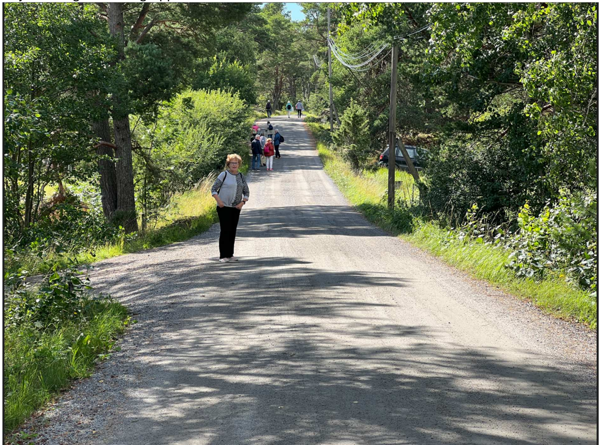
Vi har nu påbörjat vår promenad mot Bergs brygga. Sträckan är lite drygt 3 km och beräknad tid för promenaden är 40 min effektiv tid.