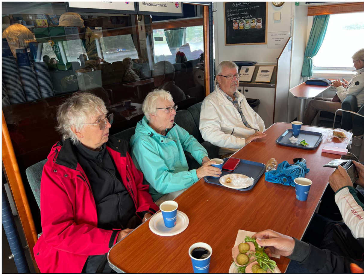
Här det nog lika stort intresse för kaffe och bulle som den pågående VM-matchen mot Japan.