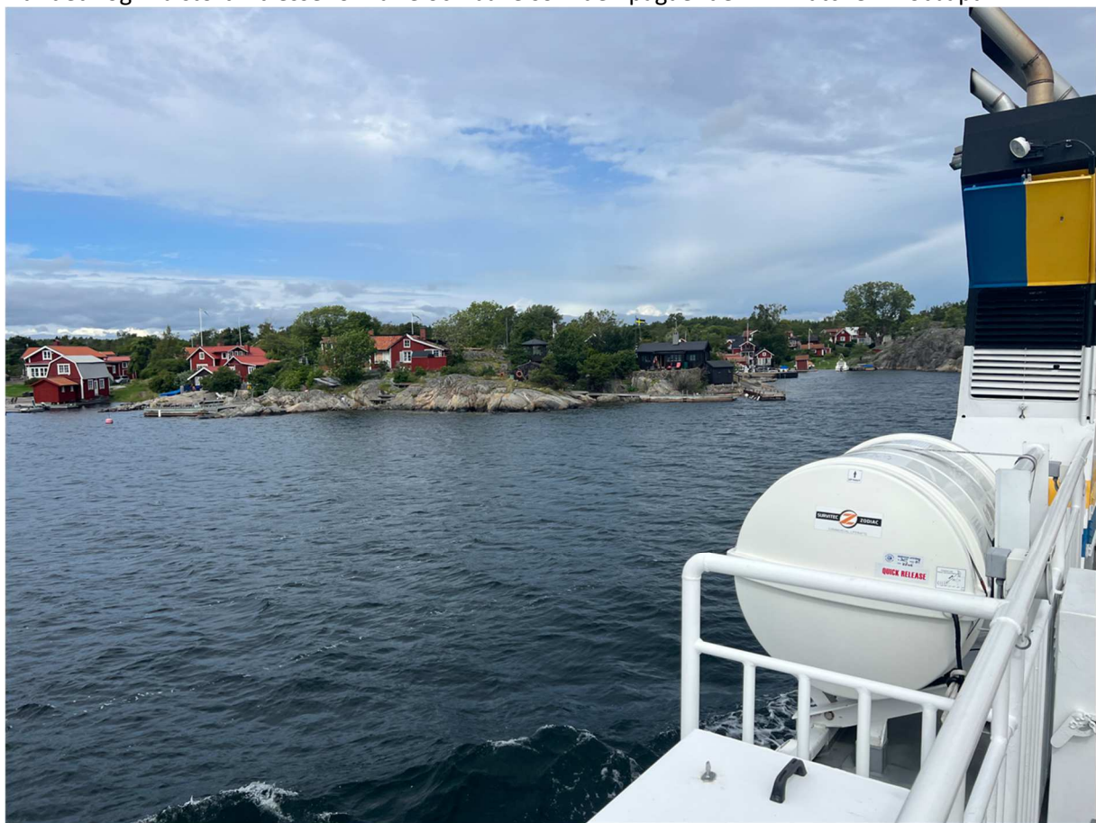
Båten lade till vid ett antal olika bryggor på sin väg till Möja. Var just denna bild är tagen har jag ingen koll på