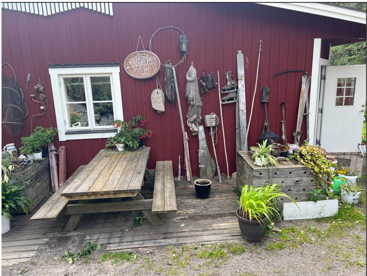
Diverse fiskeredskap utanför restaurangen