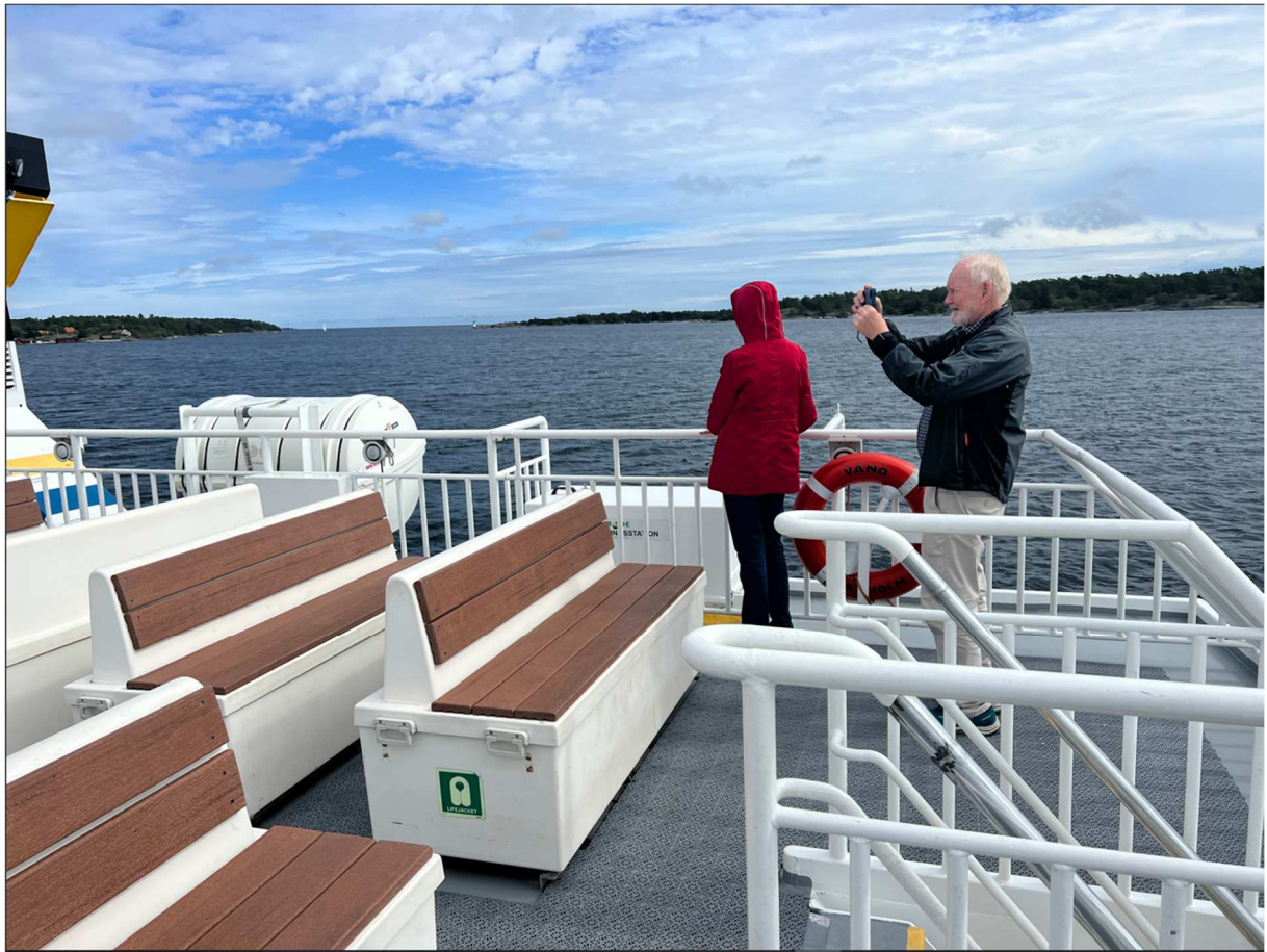
Några från vår grupp som också tog lite foton från båtdäck.