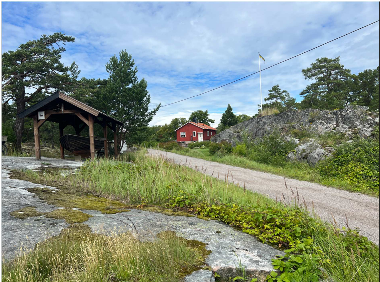
Vägen mot lunchstället