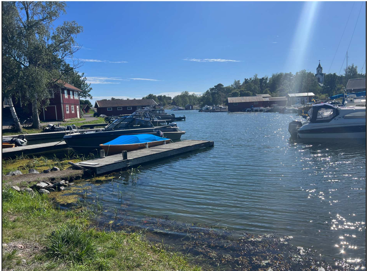
Nu närmar vi oss Bergs brygga