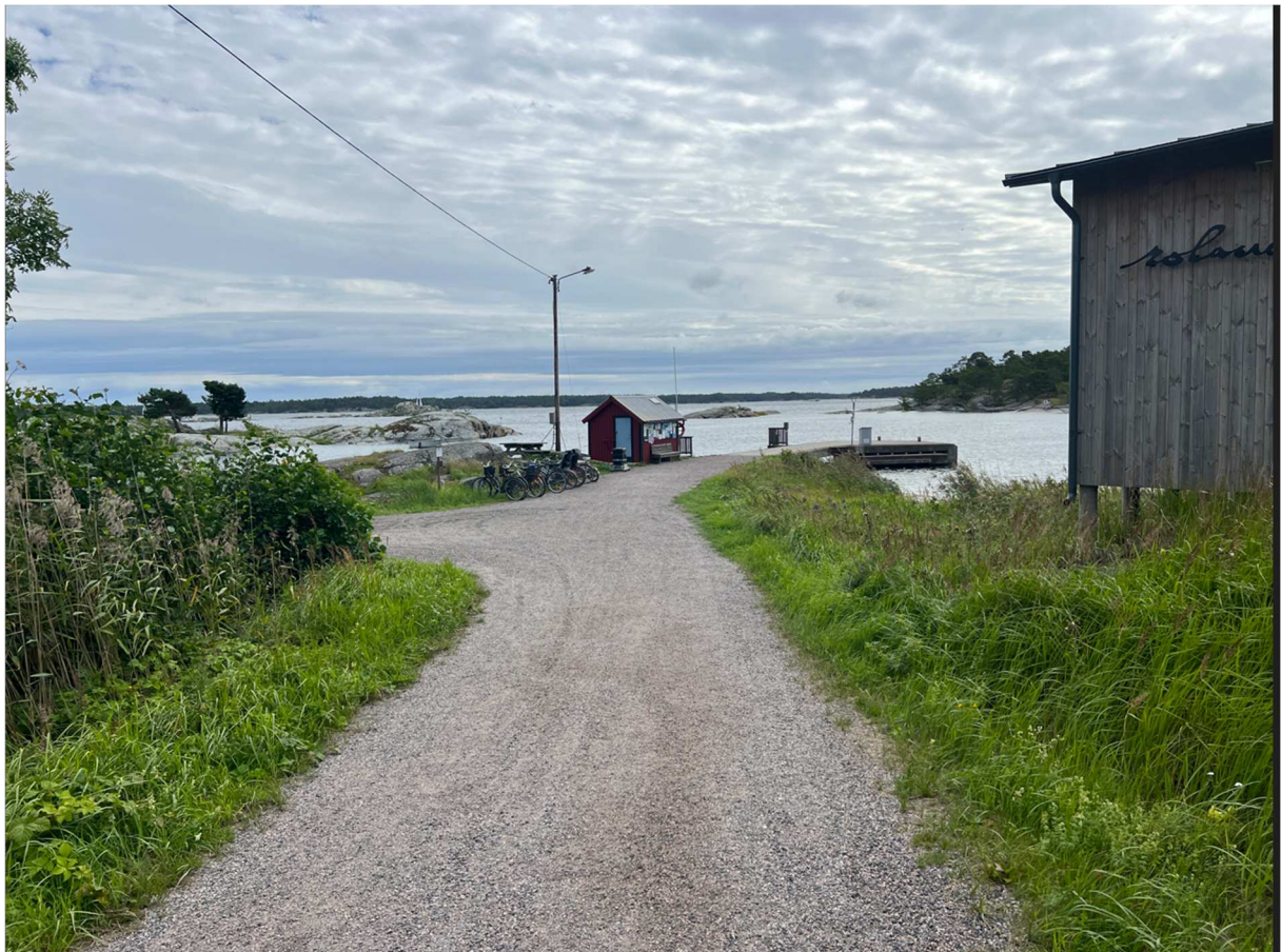
Vy ner mot bryggan