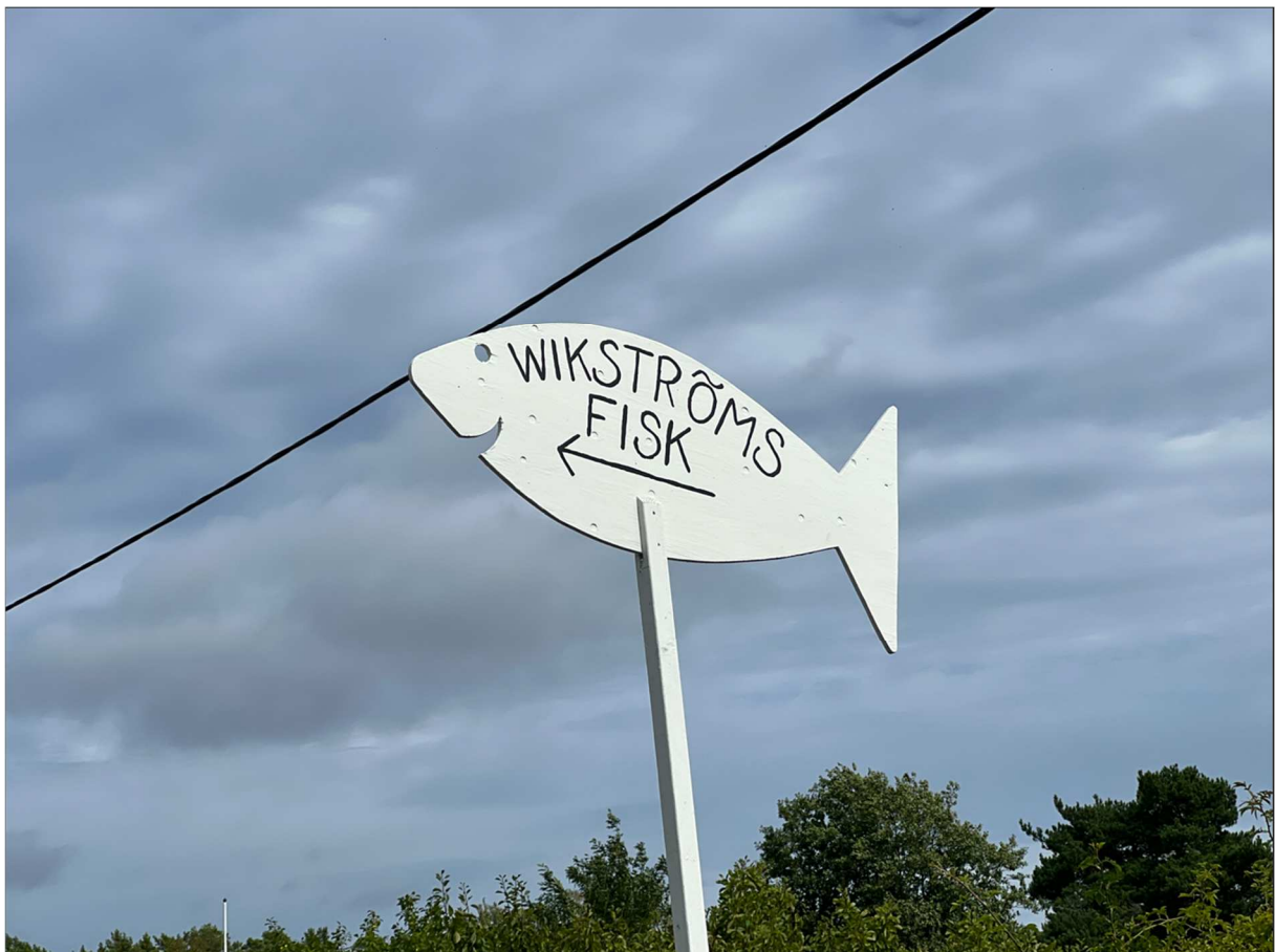
Wikströms fisk är stället vi skall intaga vår lunch