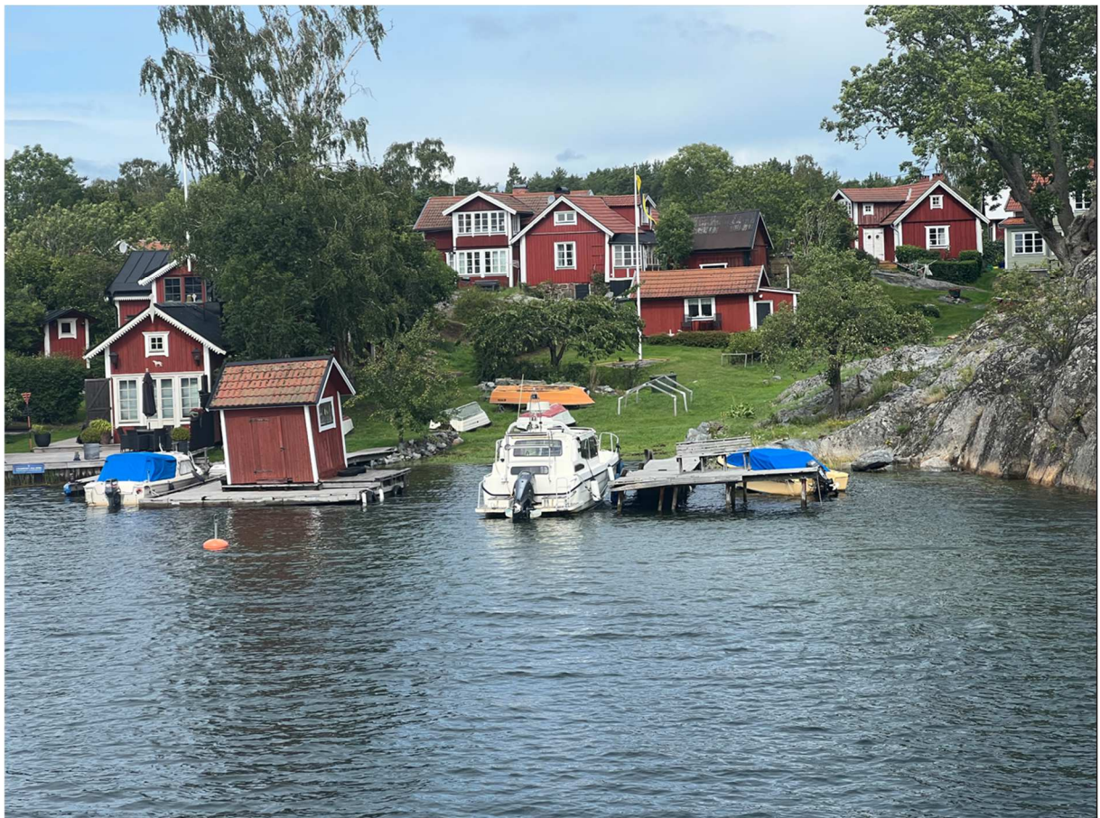
Nu är vi väldigt nära vår avstigningsort på Möja