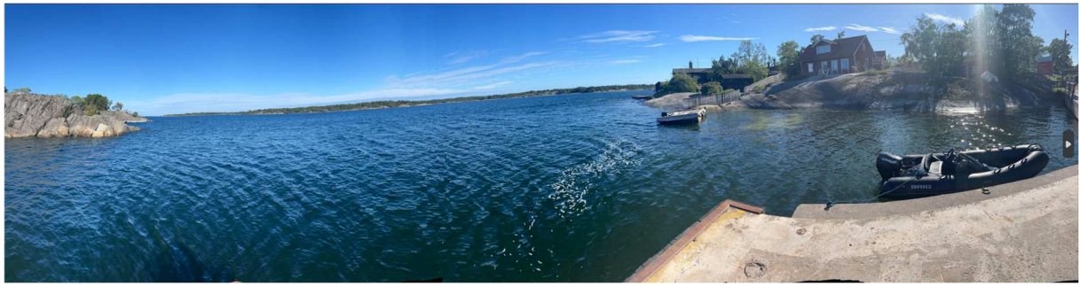
Panoramabild från bryggan