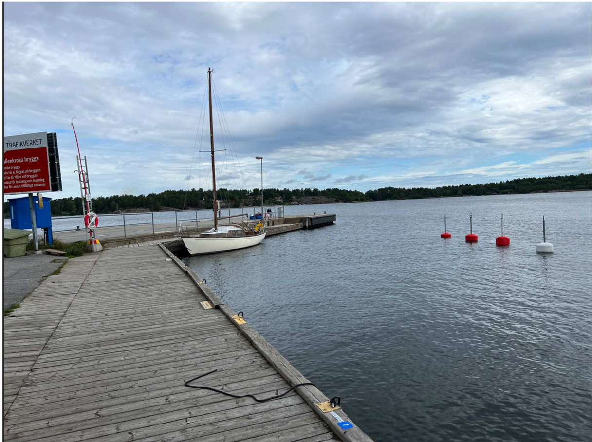
Exteriöbild från Sollenkroka brygga