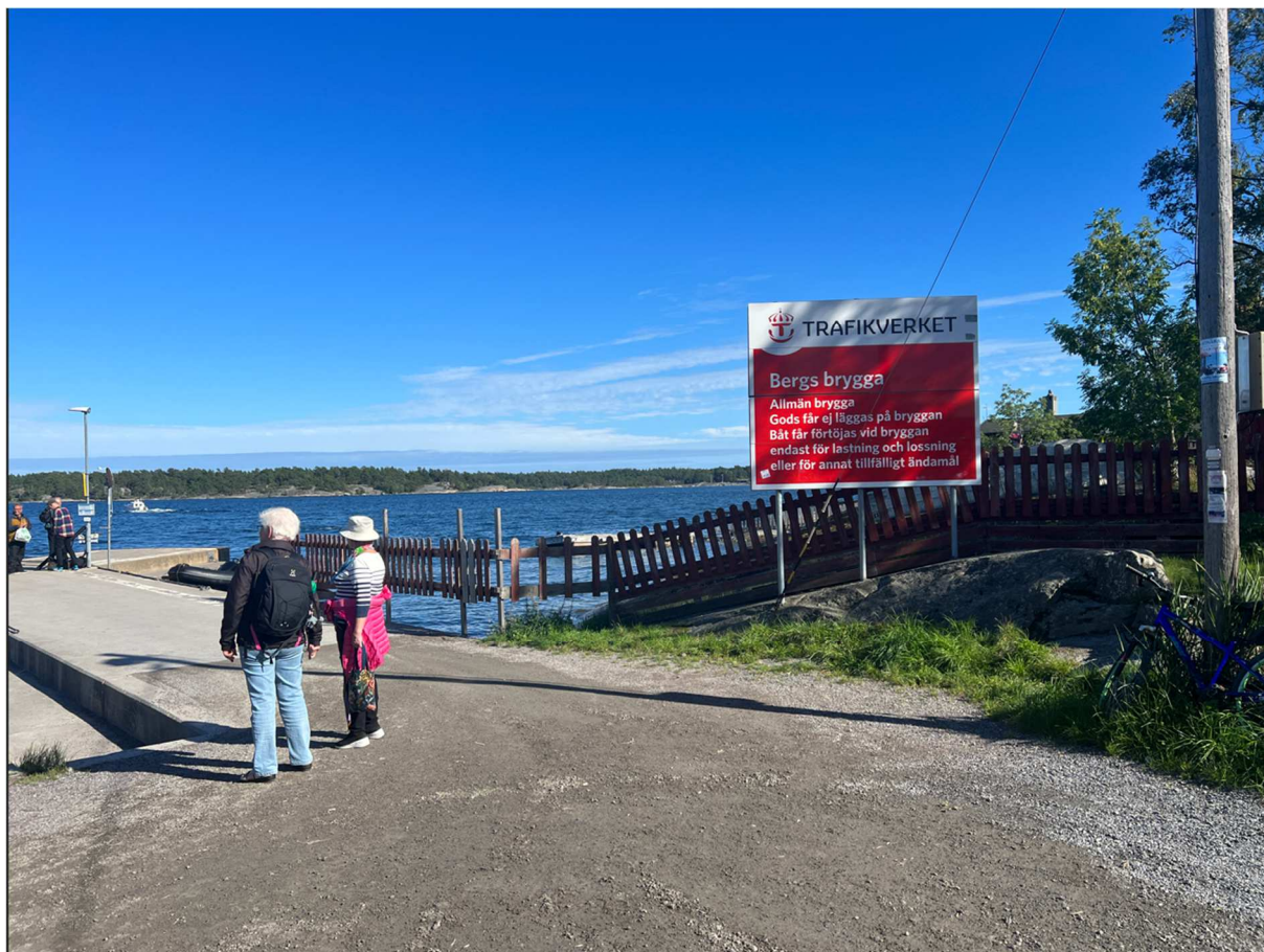
Framme vid Bergs brygga i väntan på vår taxibåt som skall ta oss mot Stavsnäs brygga.