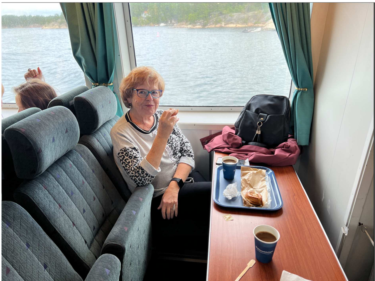
Här har vi en som njuter av både sjöturen och kaffet.