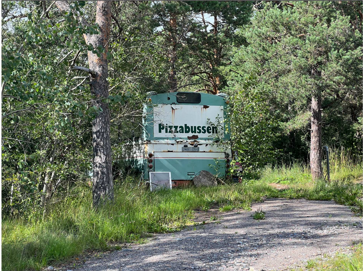
På vägen hittade jag denna buss som man undrar hur den fungerar.