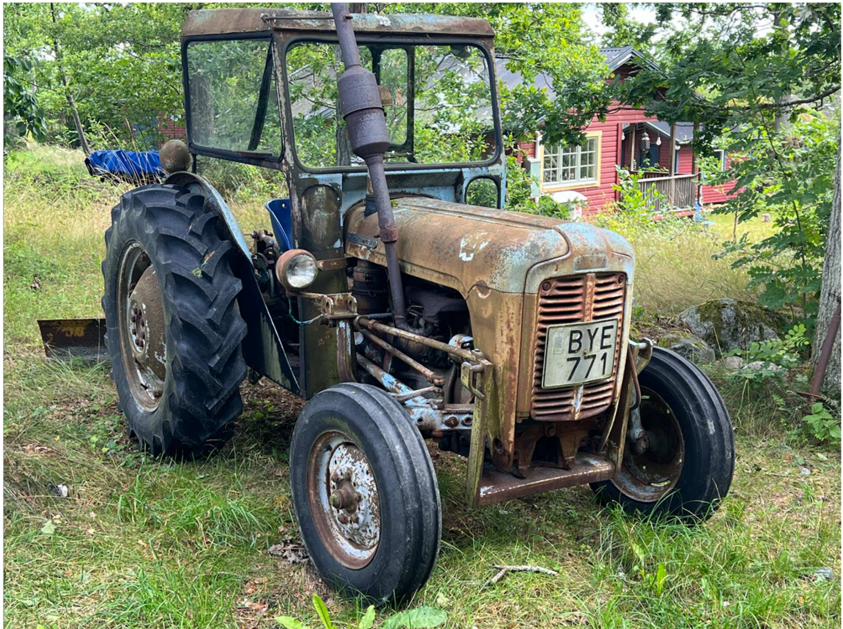
En traktor som sett sina bästa dagar stod utanför restaurangen