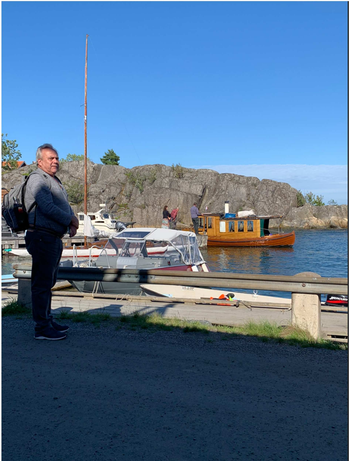
Här har även undertecknad fastnat på en bild