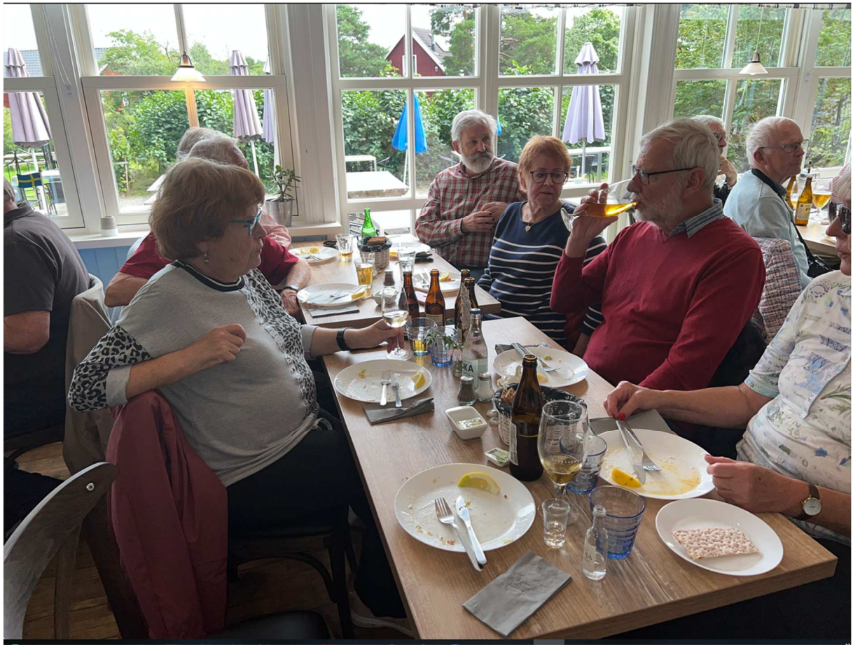
Nöjda lunchgäster från gruppen