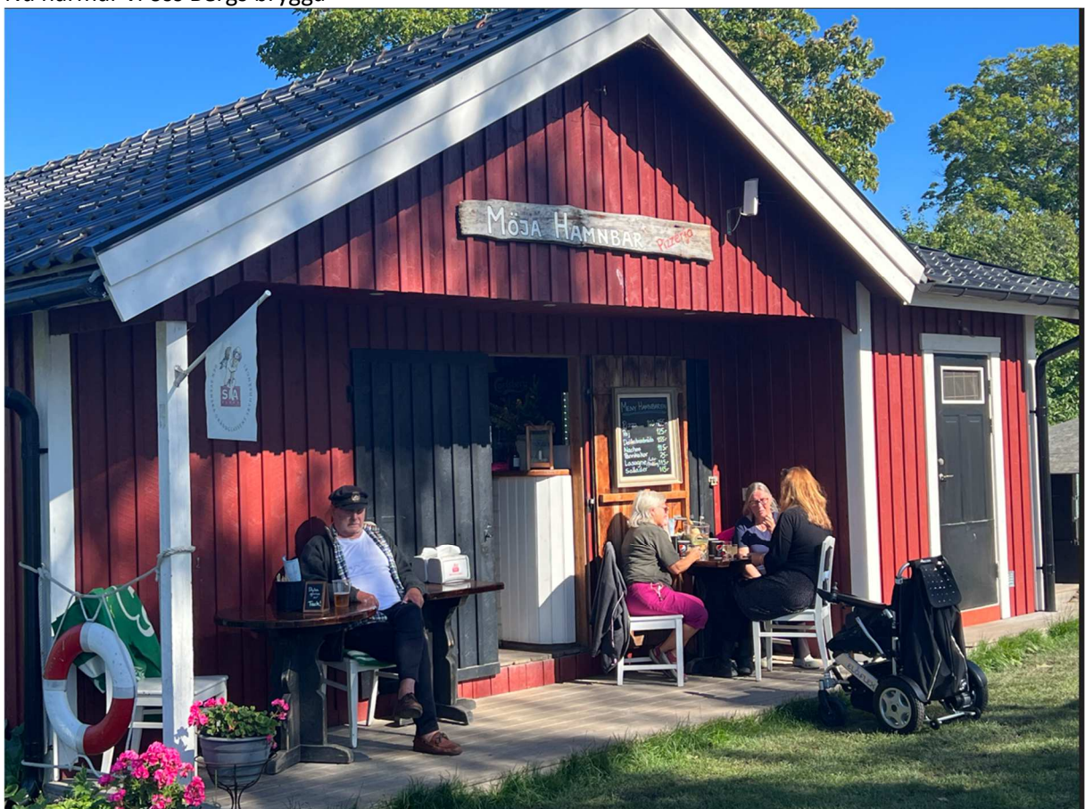
Jag och en till i gruppen hittade ett vattenhål där det blev en Carlsberg Export som satt fint efter promenaden i det sköna vädret.