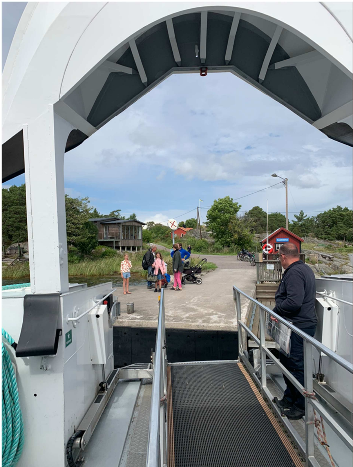
Avstigning vid Ramsmora brygga på Möja.