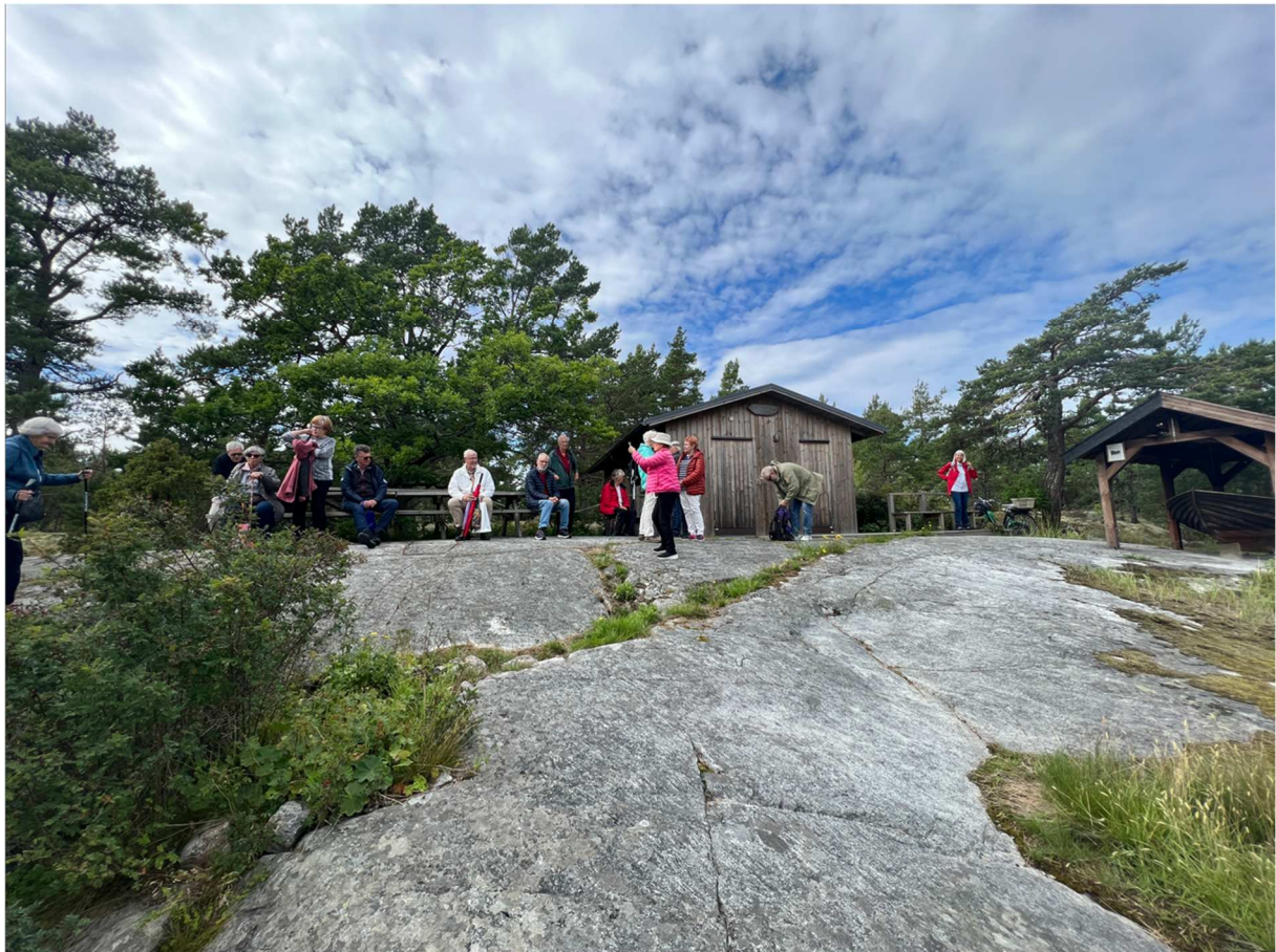
Större delen av sällskapet hade slagit sig ner utanför museet i väntan på vår guide som skulle ta oss till vårt lunchställe