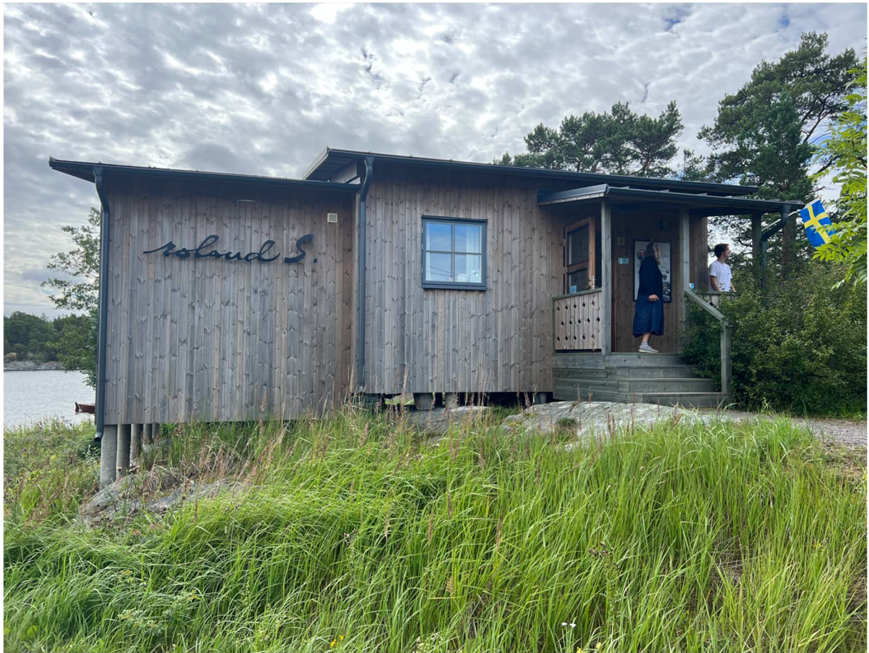
Nästa stopp var Roland Svensson museet