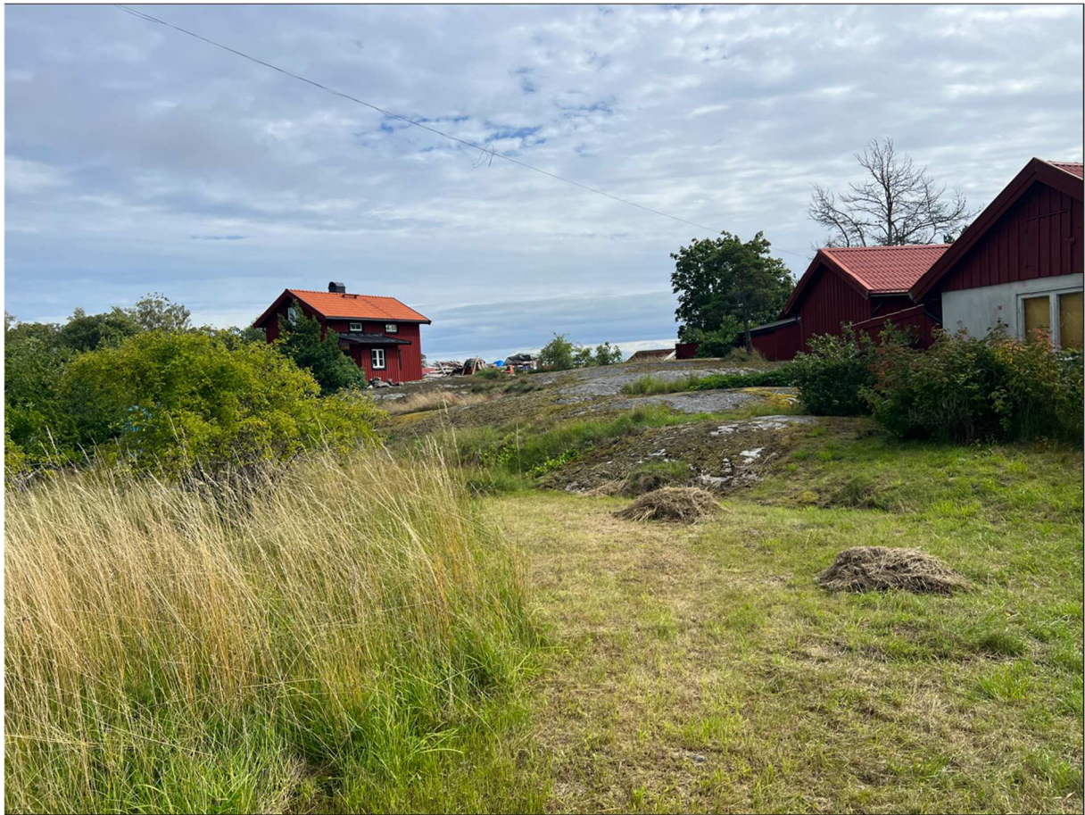
En vacker vy på vår väg