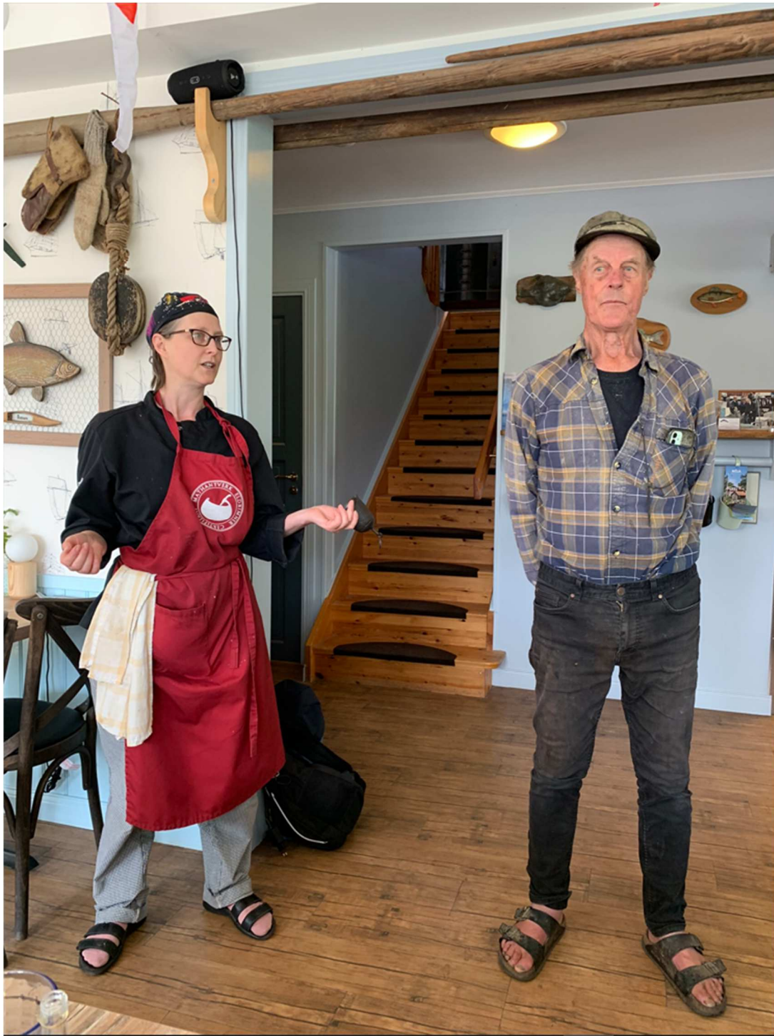
Rune tillsammans med dotterns som sköter restaurangen