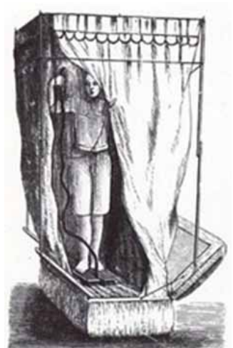
Bilden visar en dusch

Ett föredrag mellan trädgårdsmöbler och änglar.