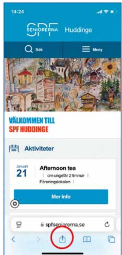
Bild på iPhone

På vår hemsida hittar du under rubriken "Digitala tips" en instruktion med bilder som kan hjälpa dig att lägga in detta på din telefon.