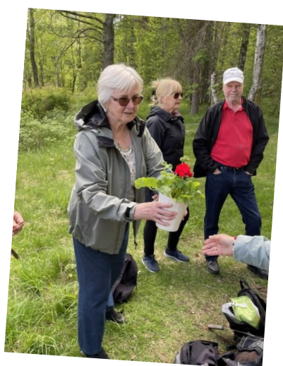
Vem får blomman tro??