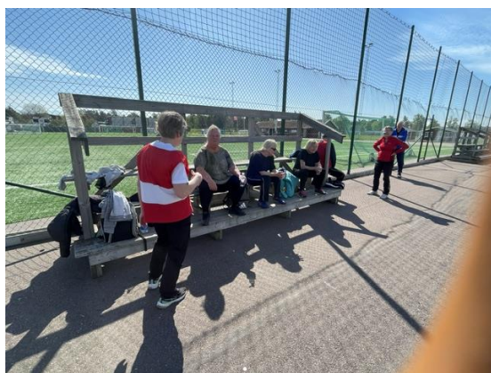
Skönt med lite paus