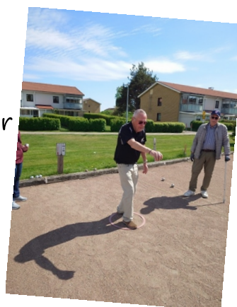
Stilstudie på Wolf