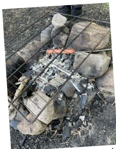
En ensam dj..! gör alls ingen glad