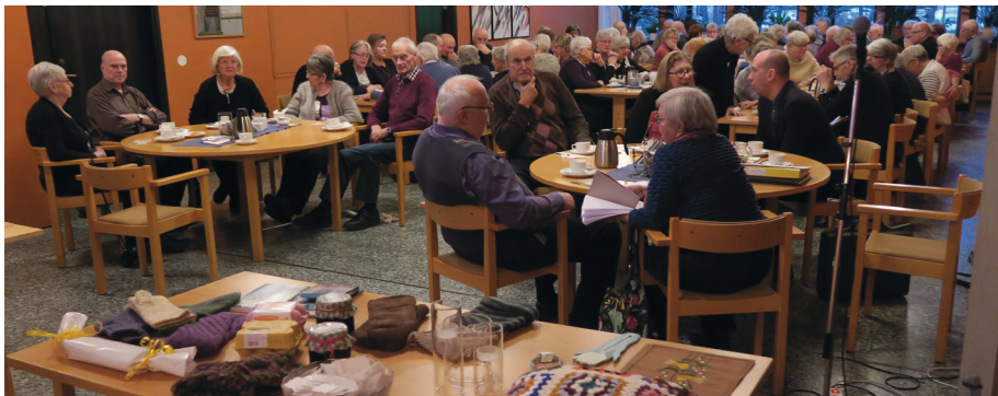
Så här kan det se ut på våra månadsmöten.