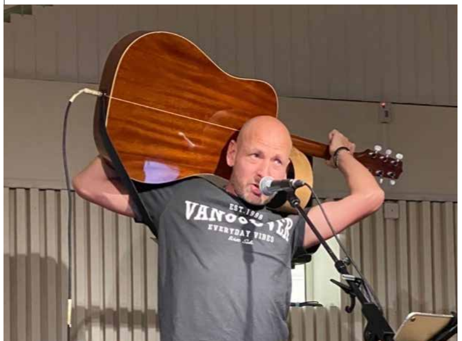
Omslagsbilden: Tomas G