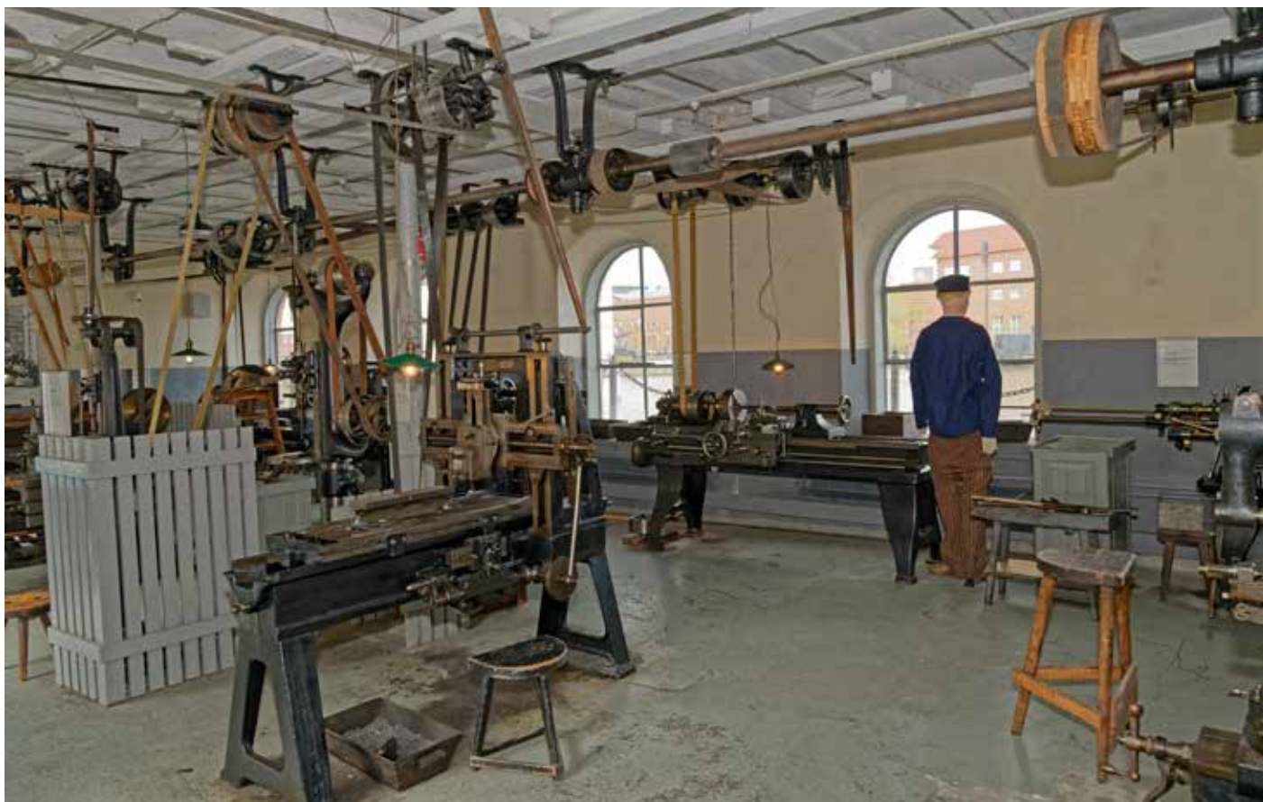
Munktell maskinverkstad. Hur en tidstypisk verkstadslokal såg ut när alla maskiner drevs med remmar i taket från en central ångmaskin.

ge elektricitet med generatorer. Alla maskinerna var körbara och mitt i hallen finns en ångpanna. Det finns även ett stort ånglok och en ånglokomobil att beskåda.