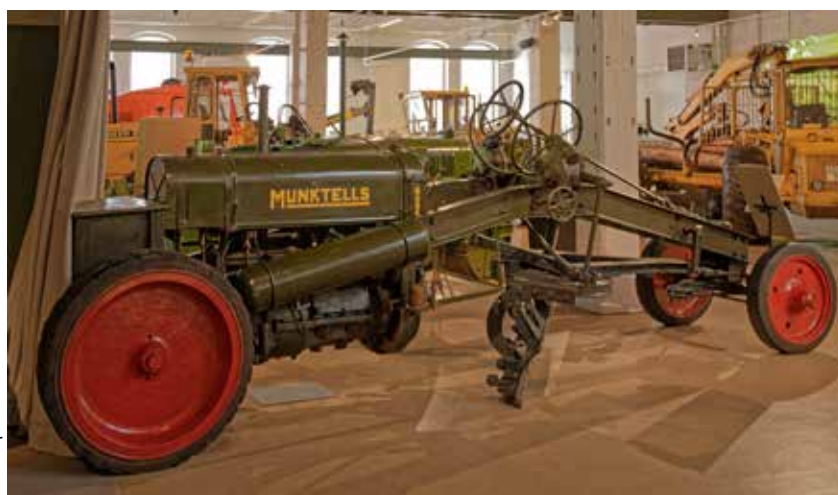
Munktell väghyvel och andra entreprenadsmaskiner från BM i bakgrunden