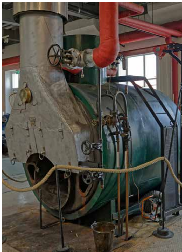
Ångpannan som man eldar i när ångmaskinerna körs.

Det finns en hel sal fylld med olika ångmaskiner. De var avsedda för att driva verkstäder med mekanisk remdrift eller