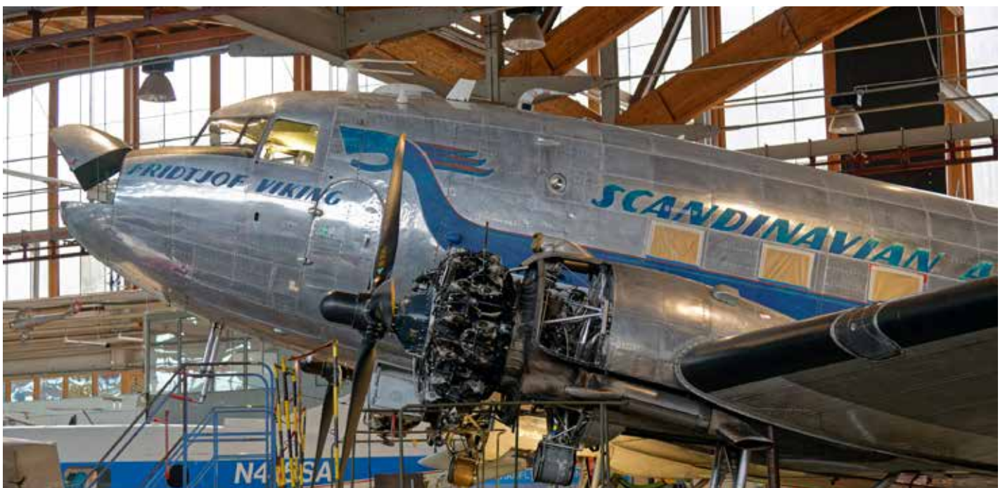
Daisy DC-3 som vårdas ömt av Flygande Veteranerna som varje år flyger med henne