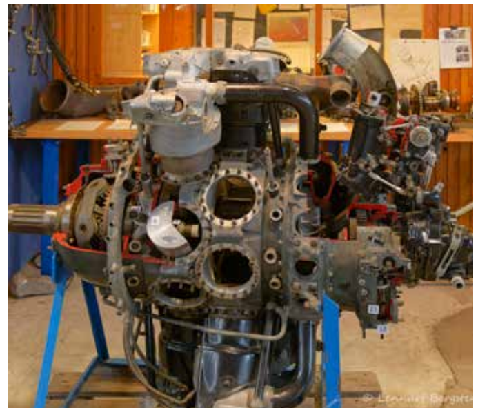
För teknikintresserade, en 18-cyl stjärnmotor i genomskärning.

Efter ett sådant här besök brukar vi bli hungriga. Det åtgärdades med att vi åt en god lunch på "Carlsson på Kajen" nere i båthamnen och efter det så stuvade vi in oss i bilarna för hemfärd till Bålsta.