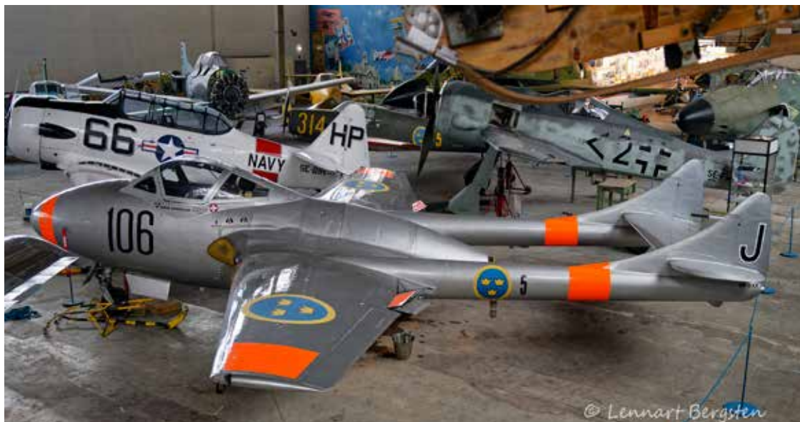
J28 Vampire T med SK16 i bakgrunden

För att komma dit, från första konstrue- rade flygplanet, till dagens avancerade kärror, har denna tidsperiod omfattat en otrolig utveckling av både teknik