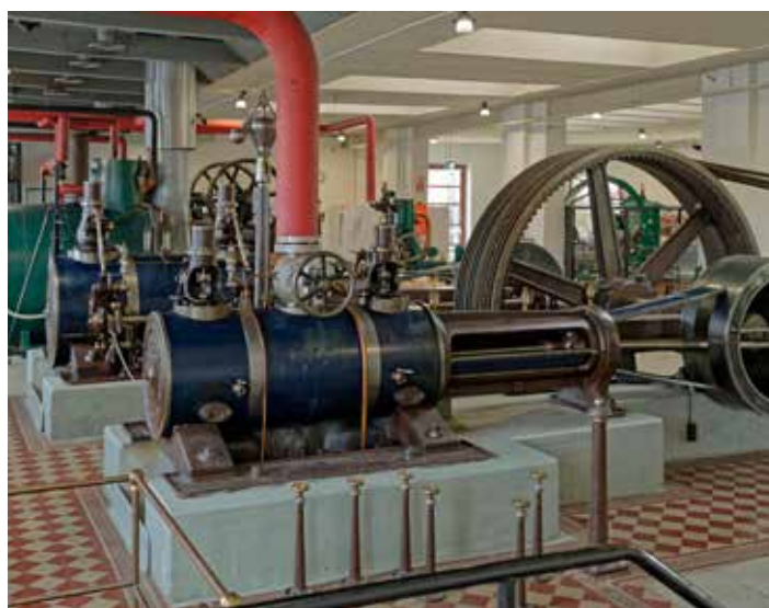
Maskinhallen med alla körbara ångmaskiner. i förgrunden en maskin som driver en generator.

Vi rekommenderar verkligen ett besök. Bra tillfälle att ha med sig barnbarnen.