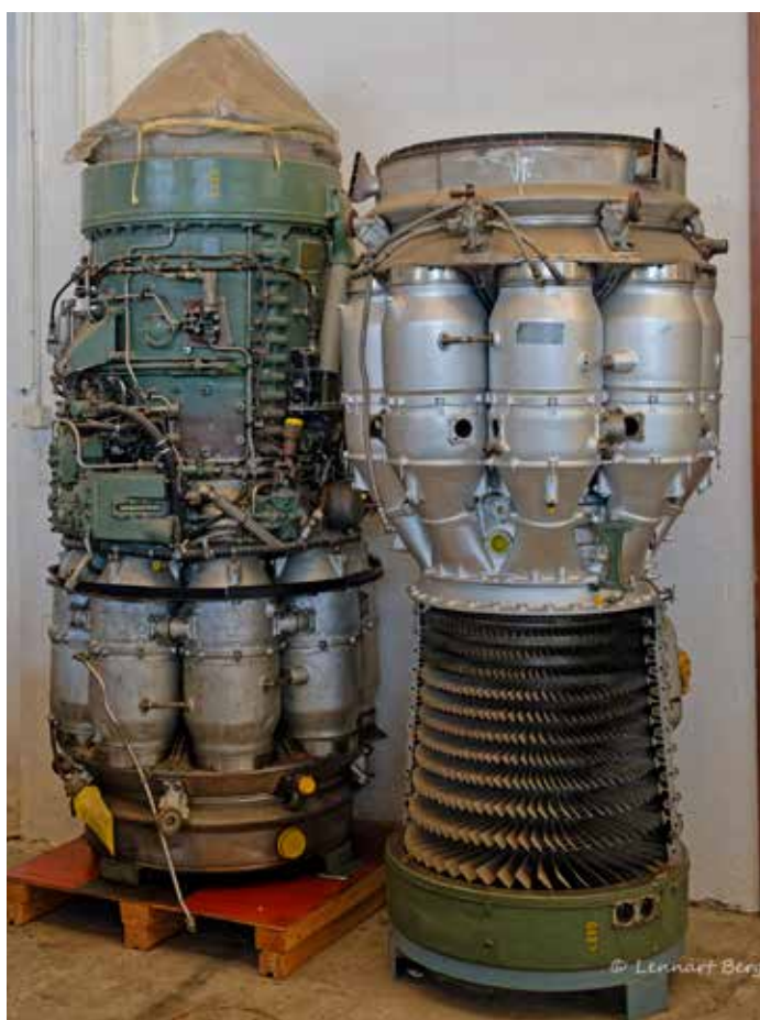
Så här ser en jetmotor ut med turbin och bränn- kammare -R&R Avon

och produktion. Men utvecklingen står inte stilla, den pågår hela tiden och nya uppdateringar görs hela tiden.