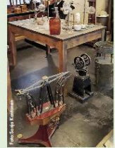
Alfred Nobel i egen hög person (som vaxdocka) bevakar sin laboratorier.

14 oktober gick en resa till Nobel-museet i Karlsgårds och vidare till Lerinsutställningen i Karlstad.