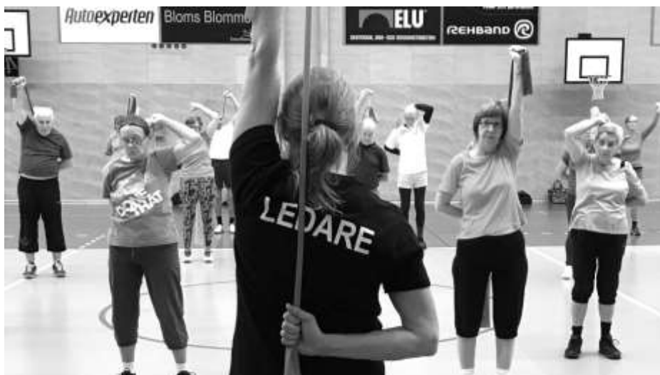
Full fart i Sollentuna Seniorgymnastik.

Nu när passen utökats så har föreningen många fler ledare som har olika inriktningar och specialkunskaper. Därav så finns det många olika pass att välja