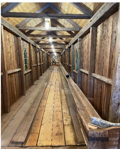
Den restaurerade Kägelbanan

Många av våra pensionärer blev sugna på att testa.