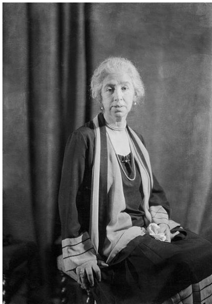
Hanna Pauli 1864 – 1940

Den första damen som tas upp är Hanna Pauli eftersom vi har vår lokal på denna gata och många av oss kommer till lokalen för möten av olika slag.