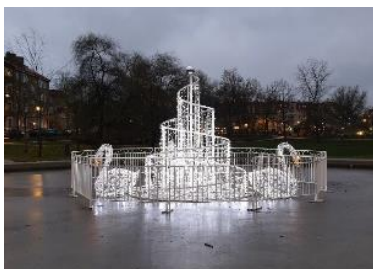
Svanar i Svandammsparken

Manuskript till mars/aprilnumret senast 3 mars 2023. Hämtning och distribution av mars/aprilnumret 13 mars 2023.