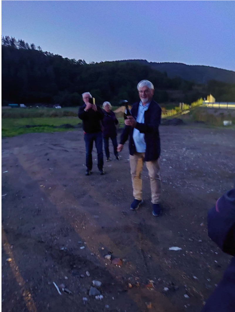
Pang. Där flög korken