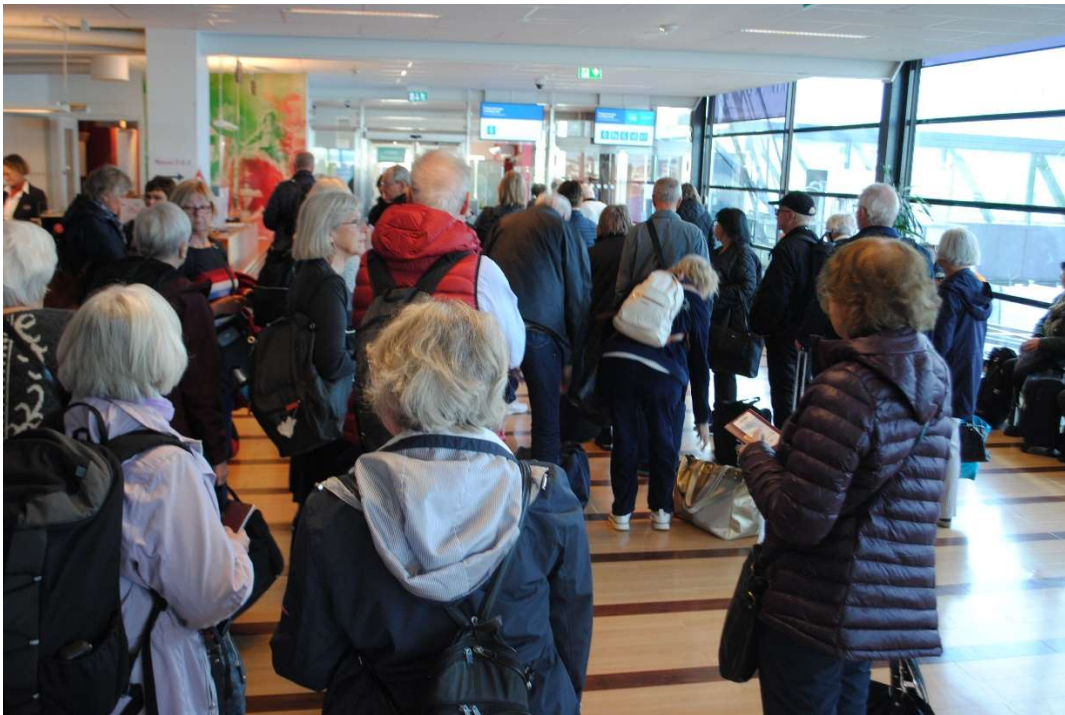
Klart att stiga ombord

Resan mot Göteborg gick snabbt med stopp för både kaffe och mat och snart hade hela gänget embarkerat Stena Gemanica för vidare transport mot Tyskland och Kiel.