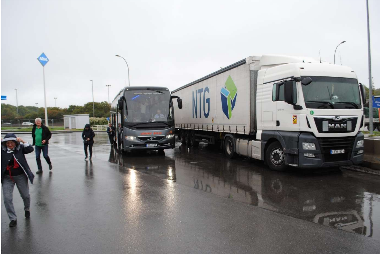
Ett stopp Luxemburg

I Reims bjöd vi på en guidad rundvandring ( i regn)