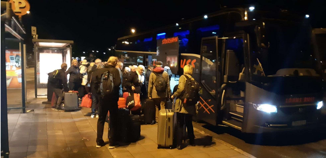
Mörkt var det när vi startade

Den 29 september samlades drygt 40 medlemmar från Freja för att genomföra årets vinresa. Denna gång gick resan till Champagne via Mosel. Två mycket intressanta vindistrikt. För att hinna med färjan till Kiel från Göteborg tvingades vi att starta redan klockan fem på morgonen från Sundsvall