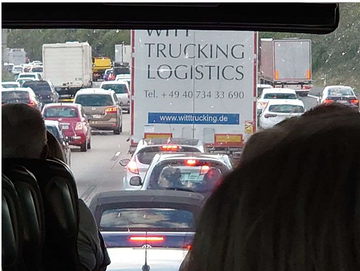
Trafiken kom från alla håll

Under färden till Trier informerade Lars-Olov Högström om Tyskland som vinland och speciellt om Mosel och dess viner.