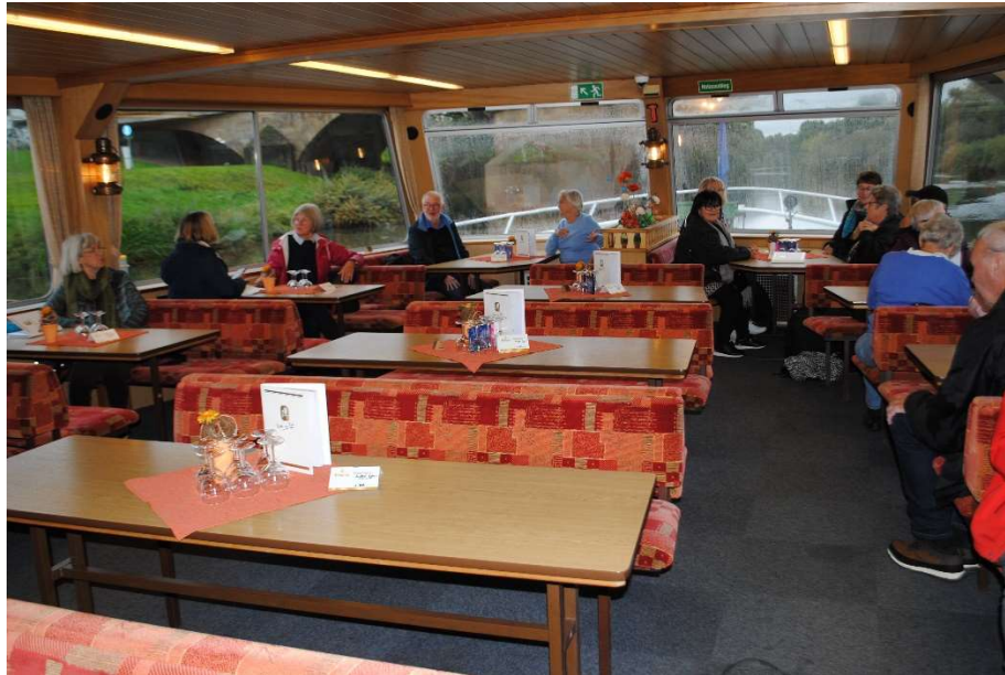
Vi hade gott om plats

Nästkommande dag var en båttur på Mosel planerad. Tyvärr var inte vädret det bästa, men vi hade hela båten för oss själva.