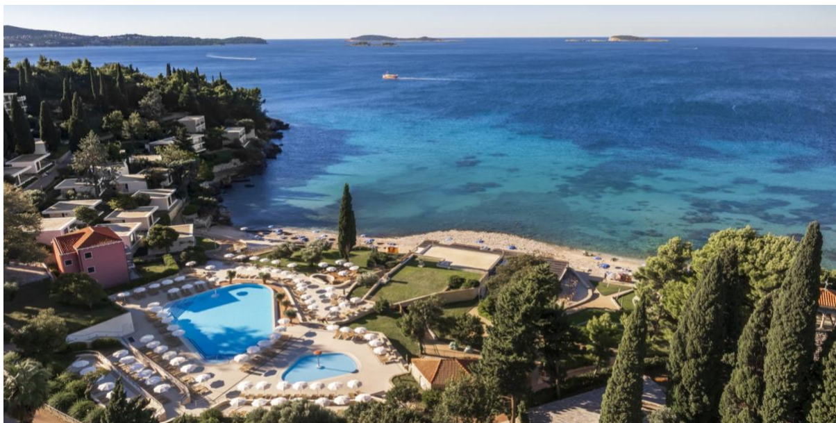
Vårt hotell i Mlini sista natten innan hemfärd