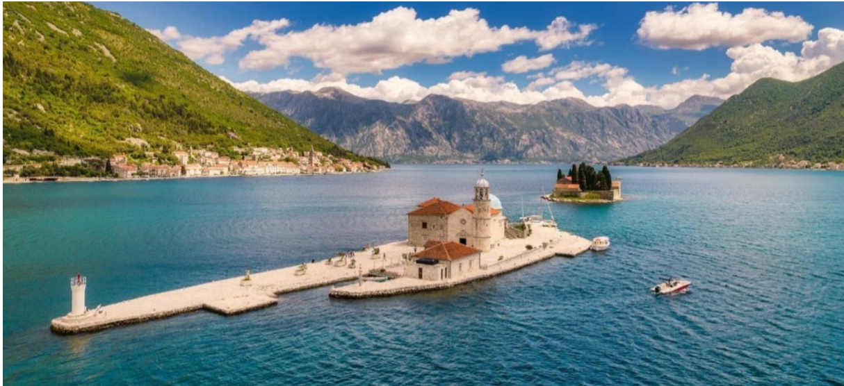
Perast – med «Our Lady of Rocks» som vi besöker på vår resa