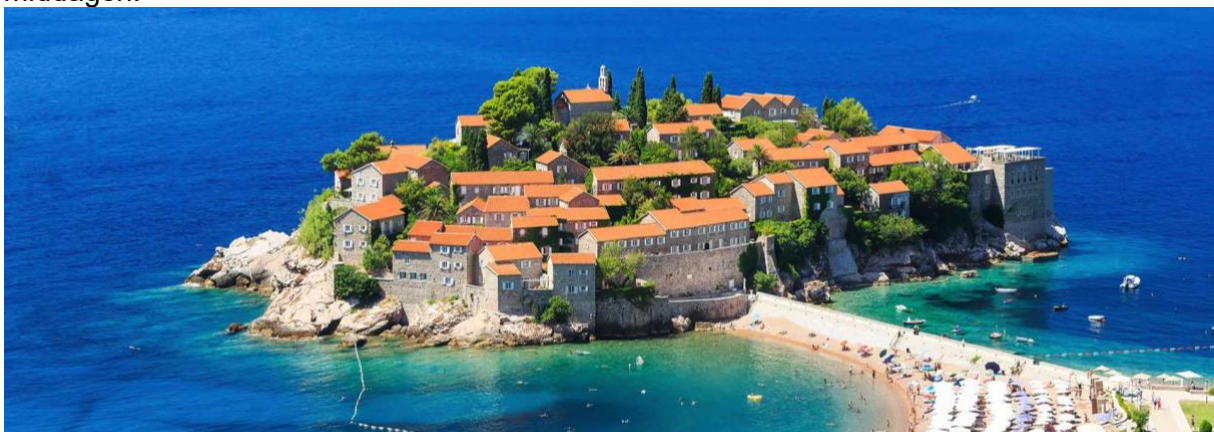
Sveti Stefan

Frukost på vårt hotell. I dag tar vi oss till nationalparken vid Skadarsjön som är den största sjön på Balkan och som gränsar till både Montenegro och Albanien. Området har ett rikt växt- och djurliv och med lite tur ser vi pelikaner här. Men innan vi kommer hit stannar vi till för en kort fotopaus vid Sveti Stefan. Från Virpazar gör vi en timmes båtutture på den vackra sjön och väl tillbaka i Virpazar äter vi gemensam lunch. Här serveras god montenegrinsk mat med dryck till maten och vi provsmakar även olika montenegrinska viner. Efter en härlig dag vid Skadarsjön påbörjar vi återresan och är tillbaka på hotellet under eftermiddagen för lite vila innan middagen.