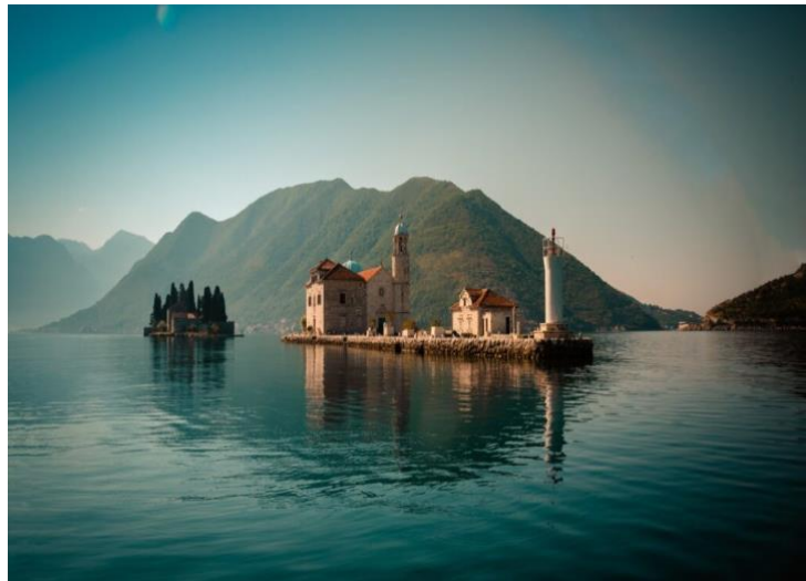
Kotor vid Kotorbukten med Our Lady of the Rocks nära Perast