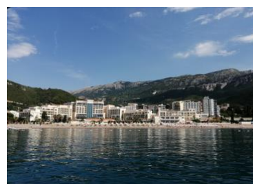
Bilder från vårt hotell i Bečići

Välkommen till höstens trevliga Montenegroresa!