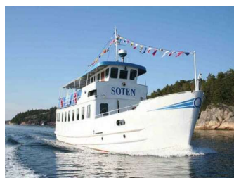
Smögen - Soten Sea