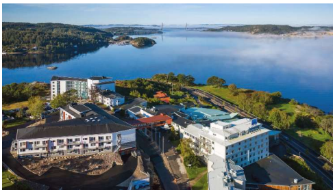
Bohusgården Hotell & Konferens

Ca. 17:00 Incheckning på hotell Bohusgården 19:00 Middag på hotellet