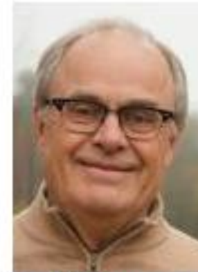
Bo Magnusson (MP)