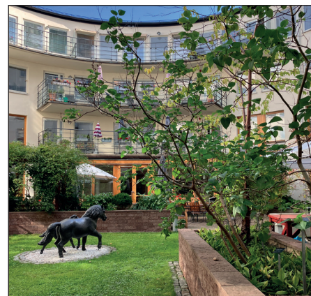
Den vackra gården.

Här finns både frisör och fotvård liksom Fosch konditori och bageri