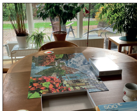
Att lägga puzzel är populärt.