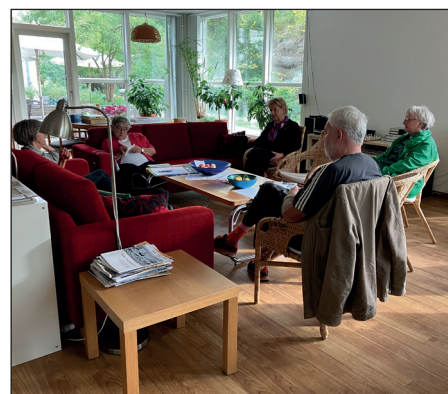
Stora sällsapsrummet, där det bl.a. visas film.