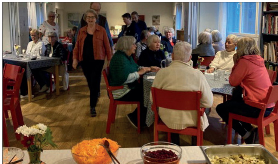
Middagen är serverad.