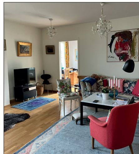
Margaretas vardagsrum.