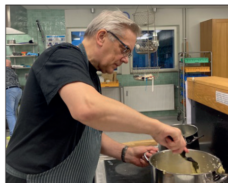
I det specialplanerade köket hjälps man åt.