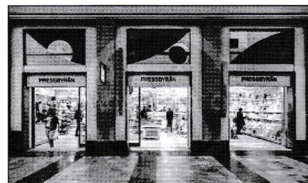
"Den nya biljettkassan".