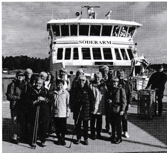
Hela gruppen bland fraktgods från båten.