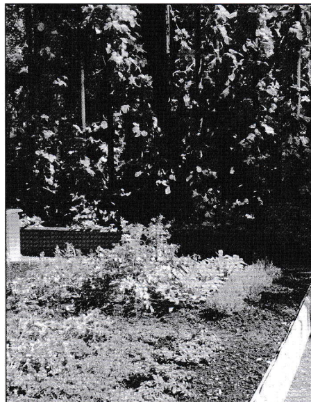
Kryddor och humle à la 1600-tal i Humlegården