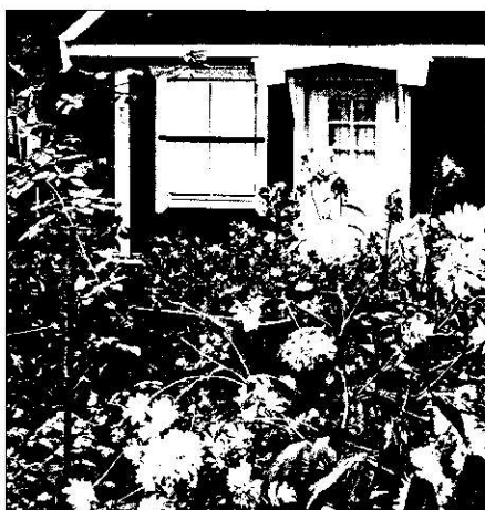
Höstlig blomsterprakt i Tantolunden.