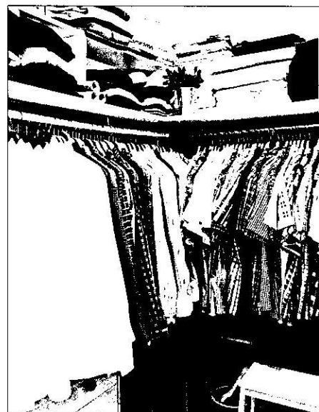
Exemplarisk ordning i garderoben.