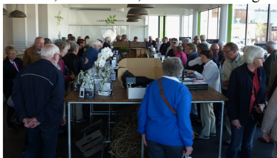
Besök på Lakritsfabriken i Helsingborg 2015

Utflykter i form av dagsresor har gjorts till Louisiana, Arken och Karen Blixen-muséet på andra sidan sundet, till Tommarps Kungsgård, Stenriket, Listerlandet, Norrvikens Trädgård, Kulturen i Lund, Vannaröds Slott, Ven, Kryssning på Immeln, Drakabygget, Ljungbyheds Militärhistoriska museum, Trumpetarbostället i Billinge, Ingeborrarp, Kulturens Östarp, Rundtur i Oderljunga, Laholm och Skottorps Slott, Afrikahuset i Hjärnarp, Åhus Absolut, Kristianstads Vattenrike, Humlalyckan, Lakritsfabriken och Bryggeriet i Helsingborg, Beredskapsmuséet, Skivor till kaffet i Greve, Atelje Götesdotter och Hembygdsgården i Bjärnum, Fredriksdal, Lindab Arena och Järnvägsmuséet i Ängelholm, Konstrunda i Nordvästra Skåne, Statarmuséet, Evas Strutsfarm, Tyringe museum, Kannibalmuséet och Lanthandelsmuséet i Önnköping, Svedinos Bilmuseum och Berte Museum, Resa i Piratens värld, Afternoon tea och Älgsafari, Svarta Bergen och IKEA.