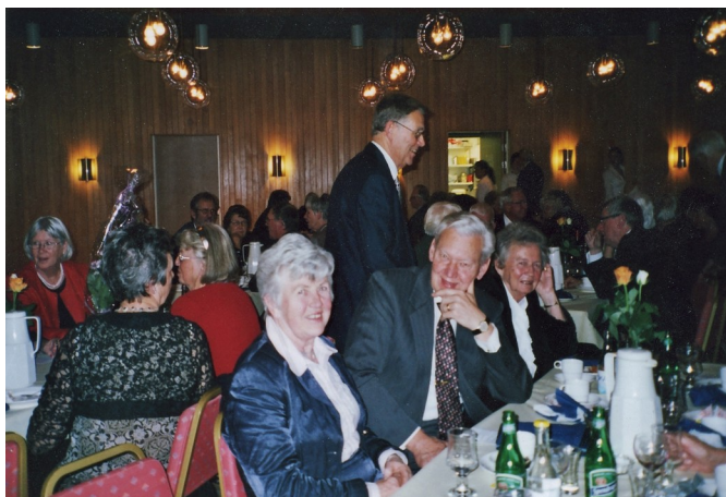
Festligt i Folkets Park på 25-årsjubiléet