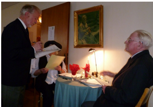
Ericsson, Underhållning av SPF Ekens Skrivargruppen underhåller på adventskaffet 2012