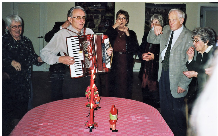
Full aktivitet på Grötfest 2003