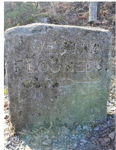
Vestra Flogneds väg