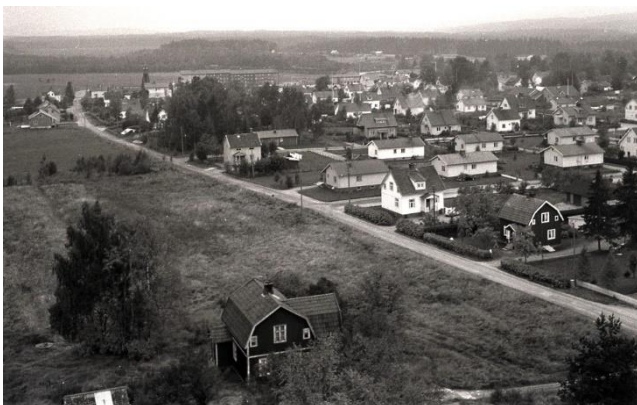
Bild 3 o 4 är vyer över bebyggelse i Charlottenberg