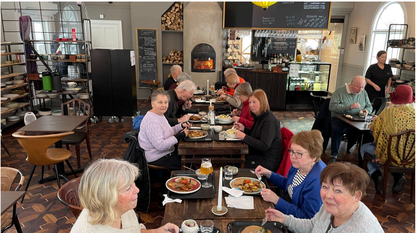
Efter vår vandring, samlade vi oss vid centrum bordet och intog en god lunch på Lilla Gula.