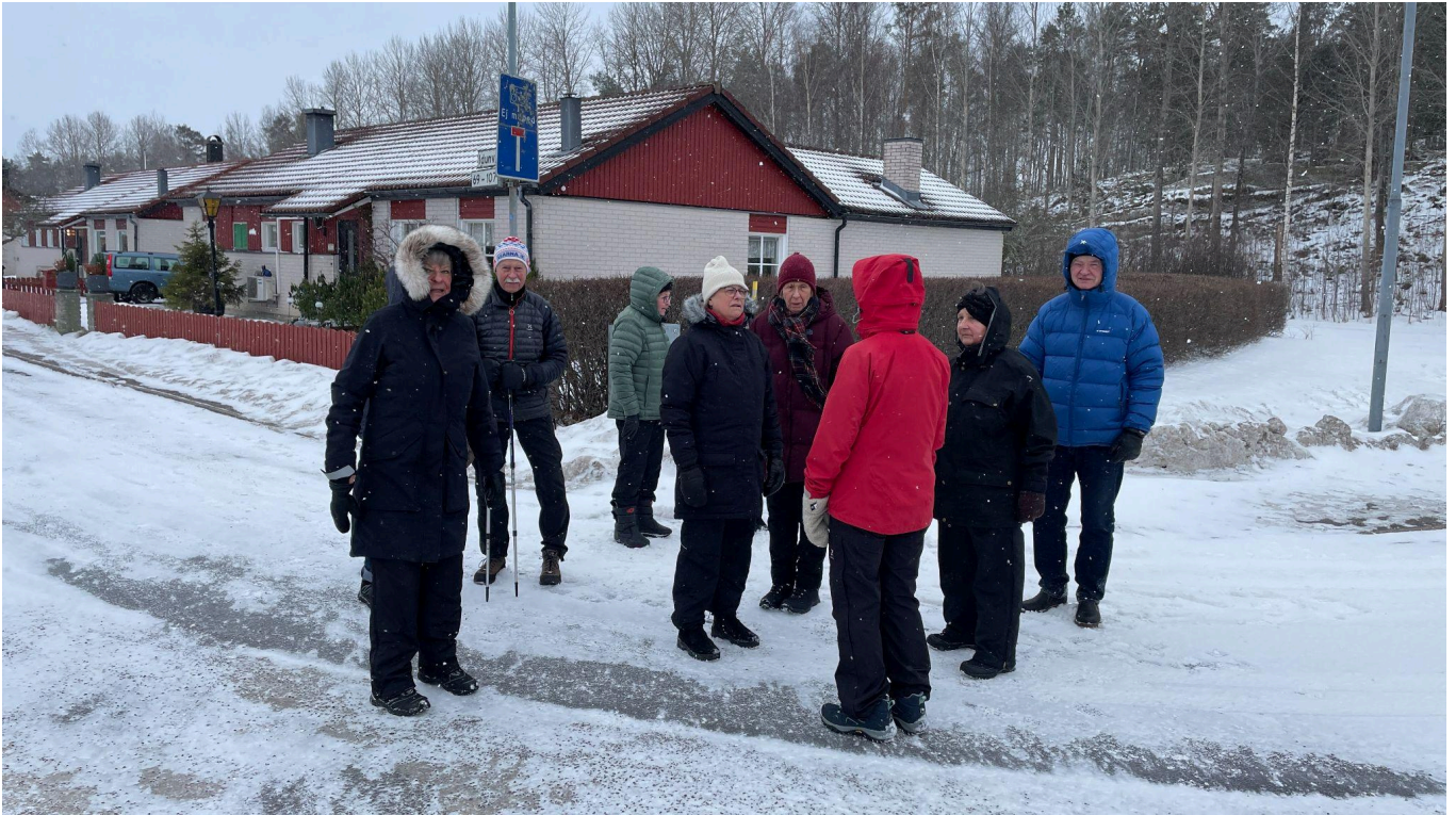
En liten paus i det blåsiga vädret.