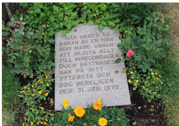
Fritiof Nilsson Piratens grav