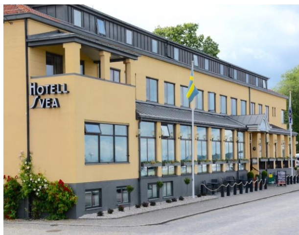
Hotel Svea i Simrishamn