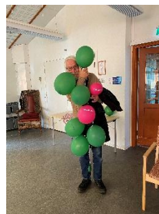
Aktiviteter t ex Digitalidagen på Bollegården