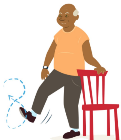
Stå på ett ben

Gå på hämlarna en viss sträcka. Gå därefter på tå. Ta stöd med handen vid behov. För att öka svårighetsgraden kan du minska handstödet och öka gångsträckan successivt.