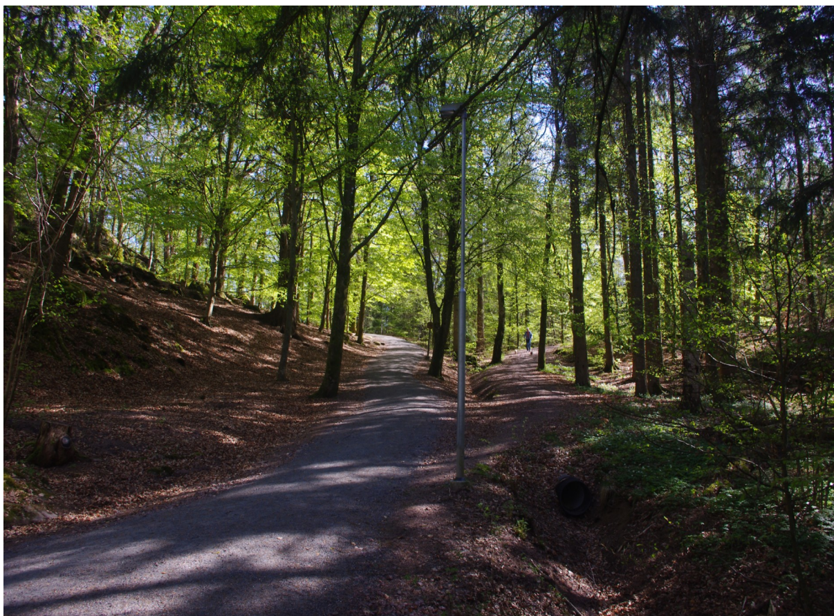
Jämmerberget i Kärra