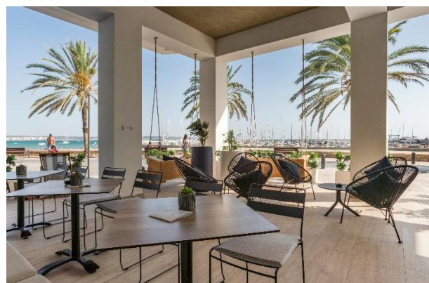
Utsikt från hotellets terrass

I priset ingår transfer Västerås – Arlanda t/r, flyg t/r, 7 övernattningar med del i dubbelrum, 7 frukostar, 6 middagar på hotellet inklusive 1 glas vin, 1 middag på restaurang dag 7, 4 utflykter inklusive luncher enligt program, 1 utflykt till Sineu marknad, 1 utflykt till Drakgrottorna, inträde till katedralen La Seu samt whispers. Med på resan finns också vår reseledare som genom sin yrkesmässiga kunskap bidrar till guidning, service och trygghet.