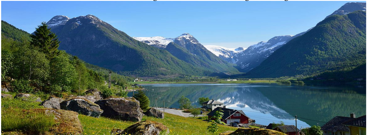
Vacker natur längs Sognefjorden

Efter frukost påbörjar vi resans sista etapp. Vi kör nu direkt upp till Holmenkollen som ligger en mil utanför Oslo, ett känt skidcenter vintertid. Här kan man ta sig upp i hoppornet för magnifik utsikt, eller bara promenera vid skidcentret där Anders Södergren en gång välkomnades av 50 000 norrmän när han vann femmilan 2006 och 2008. Därefter kör vi ner till Oslos centrum och tar en längre paus. Vi promenerar tillsammans till Aker Brygge, ser rådhuset, den nya operan och flanerar på Oslos paradgata Karl Johan. Vid 15-tiden fortsätter vi hemåt, via Svinesundsbron till Rasta Håby (Munkedal), där resans sista middag serveras. Vi beräknas vara tillbaka i Göteborg vid 20-tiden efter en härlig resa i Norges vackra natur.