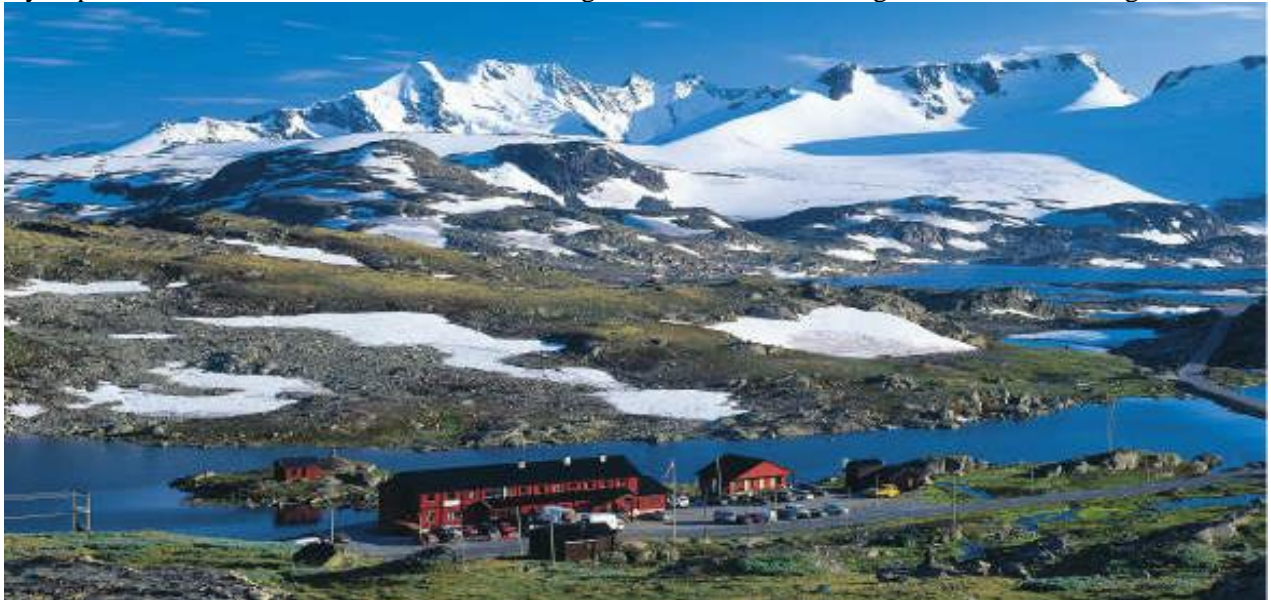
Sognefjällsvägen, en av Norges vackraste fjällvägar

Samling vid OKQ8-macken Kärningberget kl. 08.00, vid Västerträffen kl. 08.10 och på Frölunda Torg vid gaveln Resecentrum kl. 08.20. Vår första etapp går norrut förbi Uddevalla, Tanumshede och gränsen till Norge över Svinesundsbron. Vi passar på att ta lämpliga pauser längs vägen och fortsätter förbi Oslo till Nebbenes Kafeteria där dagens lunch serveras. Resan fortsätter nu till Lillehammer där vi tar en kortare paus för att se lite av staden som stod värd för vinter-OS 1994. Vi checkar sedan in på Scandic Hotel Hafjell i Øyer, precis norr om Lillehammer och så småningom samlas vi för middag i hotellets restaurang.