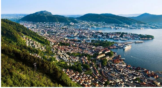
Bergen med Fløibanen