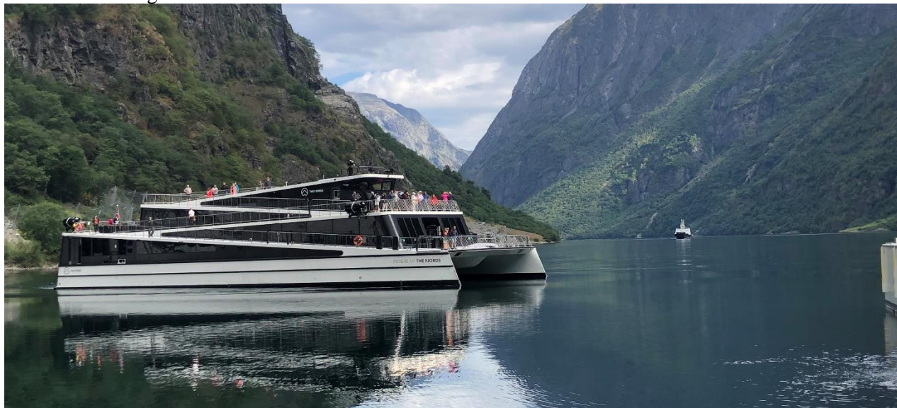
Med båt på Nærøyfjorden

skummande forsar, genom 20 tunnlar och bjuder på så många utsiktspunkter att många gärna åker flera gånger upp och ner mellan högfjället och fjorden! Vi väljer att gå av på Vatnahalsen station där vi serveras lunch på Vatnahalsen Högfjällshotell i härlig fjällmiljö. Deras specialitet Rallarsoppa är självklart dagens meny! Vi reser tillbaka till Flåm och skall nu på en underbar två-timmars båttur på Nærøyfjorden. Nærøyfjorden räknas som den absolut vackraste delen av Sognefjorden. Glöm ej kameran! I Gudvangen går vi av båten där bussen väntar på oss för vidare färd till Voss og Park Hotel Vossevangen som blir vårt hem i två nätter. Middagen serveras efter ankomst.