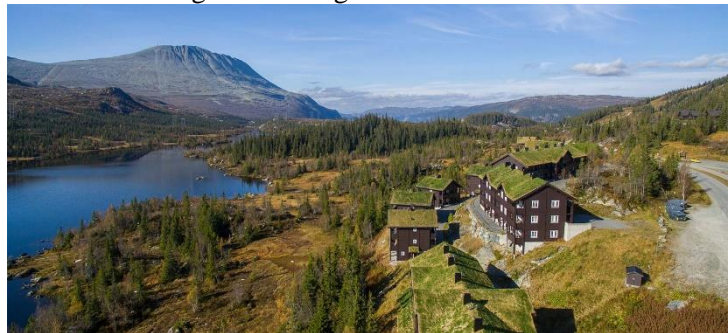
Vacker natur över Hardangervidda