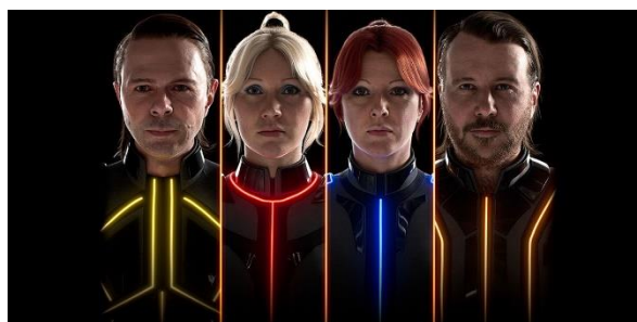
Välkommen till ABBA Voyage!