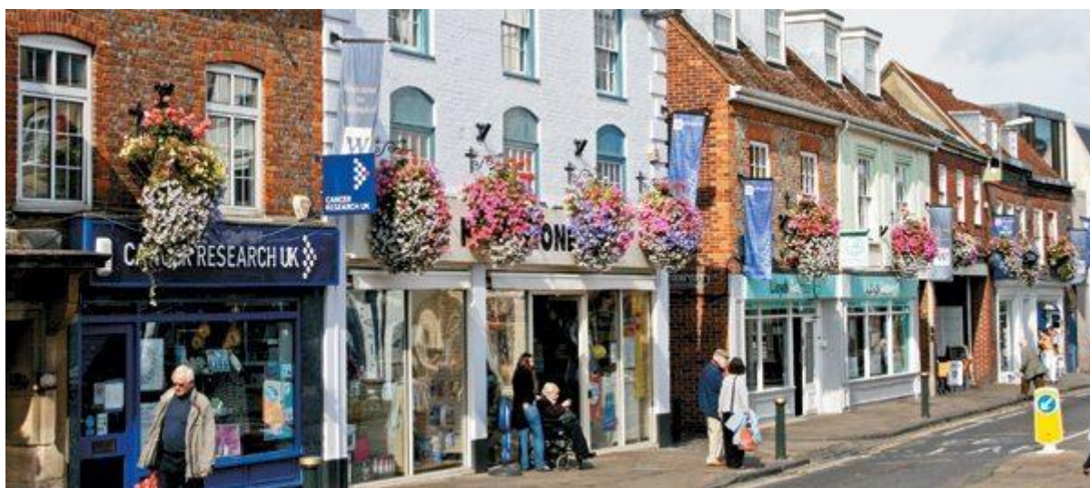
Mysiga staden Wallingford, där mycket av TV-serien Morden i Midsomer spelades in

OBS: För allas trevnad försök vara så doftfria som möjligt. Tänk på våra allergiker.