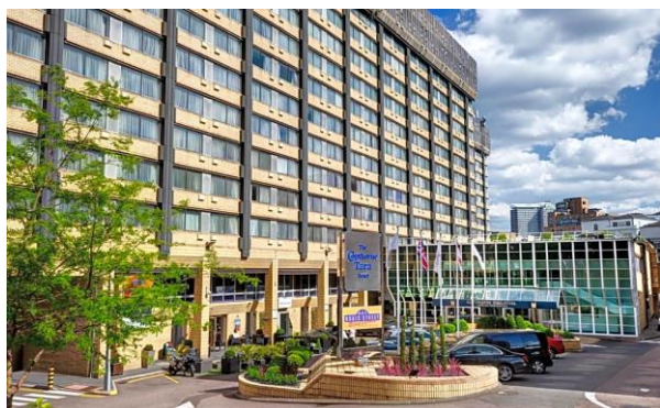
Vårt hotell Copthorne Tara Kensington

Samling vid OKQ8-macken Käringberget kl. 04.30 på morgonen dit vår moderna buss från Leja Touring har anlänt. Vi erbjuder även påstigning vid Västerträffen kl. 04.35 och vid Frölunda Torg kl. 04.45. Härifrån bär det av direkt till Landvetter flygplats där vi checkar in på British Airways flyg som avgår kl. 07.10 mot London. Vi anländer till Heathrow flygplats utanför London kl. 08.30 och efter att ha fått vårt bagage, väntar en buss som tar oss på en rundtur i London med vår guide. Vi kommer att få se det mesta av vad London har att erbjuda på en stadsrundtur, t ex Piccadilly Circus, Trafalgar Square, Big Ben, Buckingham Palace, Westminster Abbey och Hyde Park. Under utflykten serveras en enkel men god publunch. Under eftermiddagen checkar vi in på vårt fina Copthorne Hotel i stadsdelen Kensington, med promenadavstånd till Kensington High Street, Knightsbridge, Notting Hill, Earl's Court och Hyde Park. På kvällen serveras middag på hotellet.