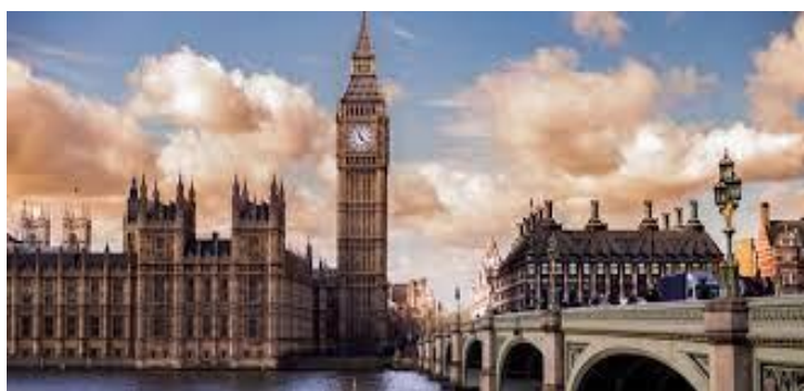
Välkommen till London