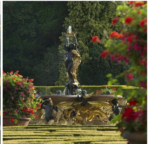
Blenheim Palace, slott och trädgård