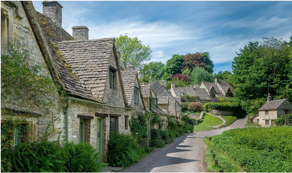
Typiska hus i Cotswolds