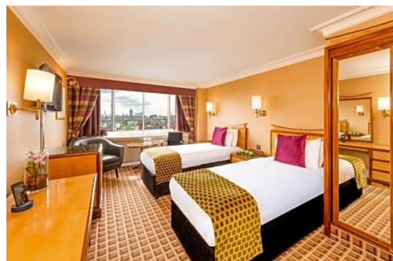
Ett dubbelrum med separata bäddar på vårt hotell