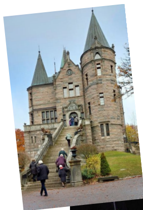
Två bilder från vårt 70-årsjubileum i Balders Hage 8 nov 2025