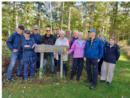
T.h. Hallaryd 18 sept 2025