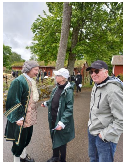
T.v. "Carl von Linné" i Råshult 23 maj 2025