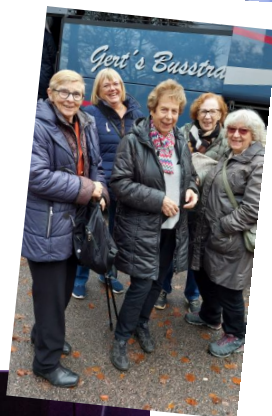
Tre bilder från vår studieresa "Läs och Res" till Växjö 28 okt 2025