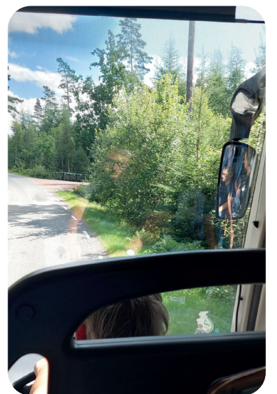
Tre gånger Stjerna.