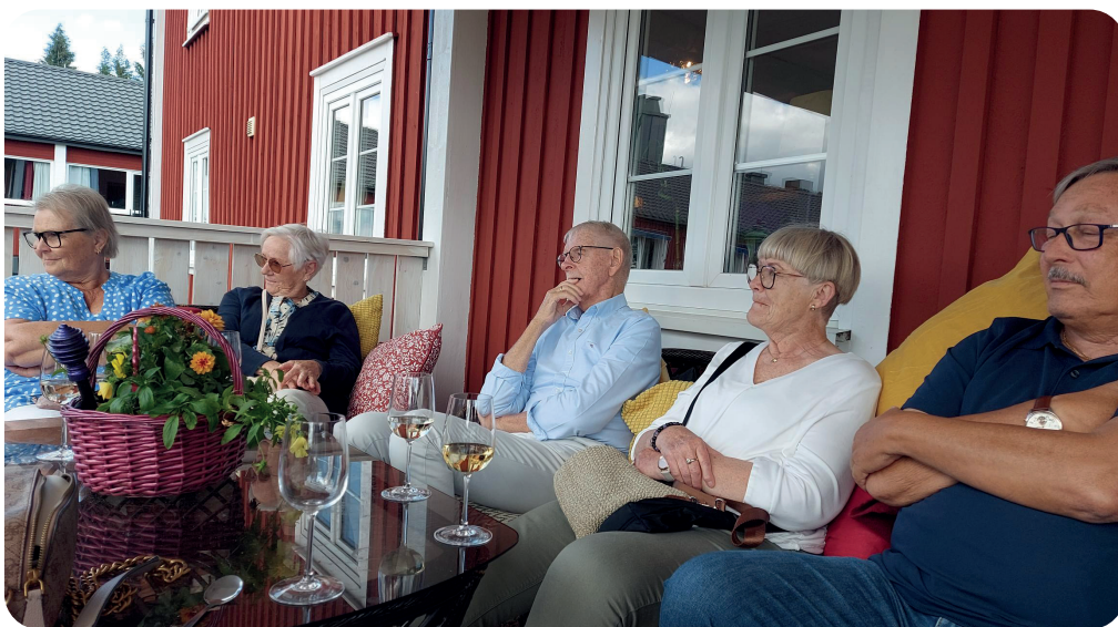
Vi som drack vin...