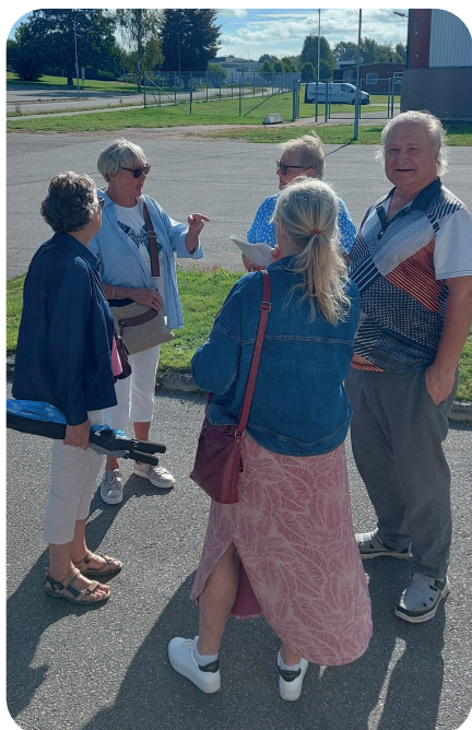
Delar ur PR-gruppen i samtal utomhus innan avfärd.