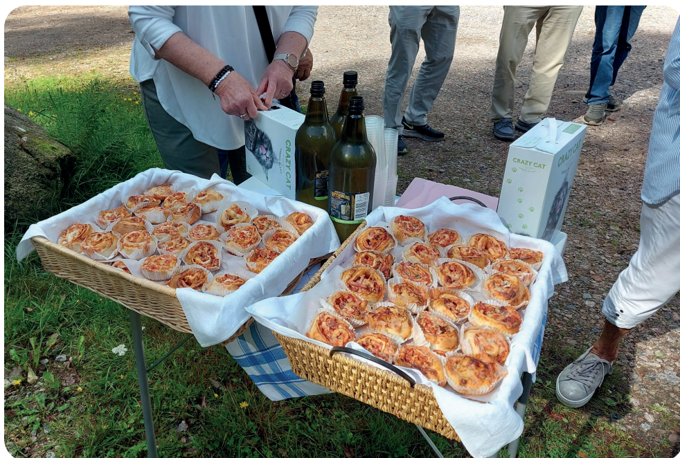
Melas smarriga pizzabullar